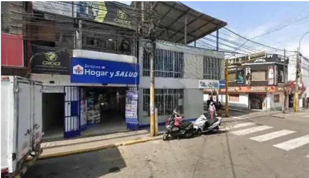
Hogar y salud precios