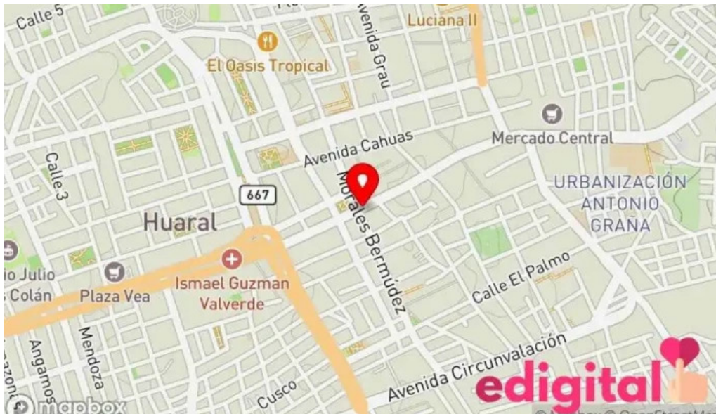
Hogar y salud mapa