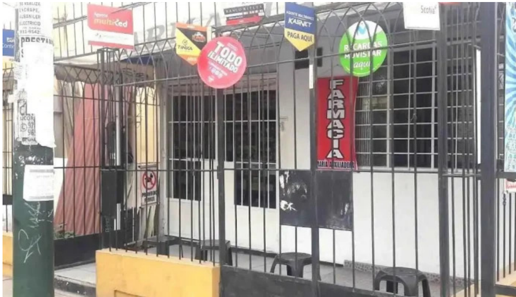
Farmacia maria auxiliadora bellavista