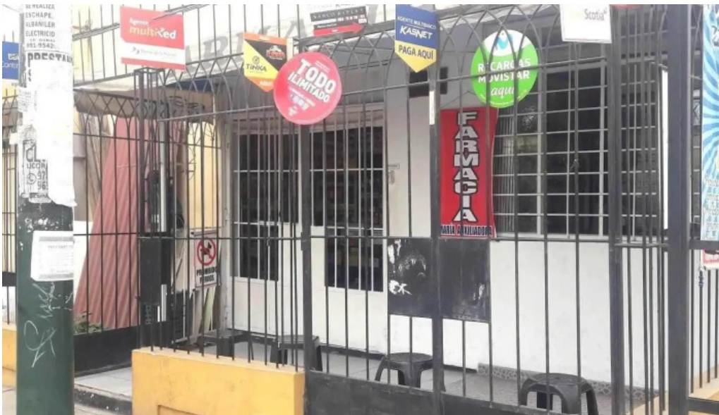
Farmacia maria auxiliadora fotos