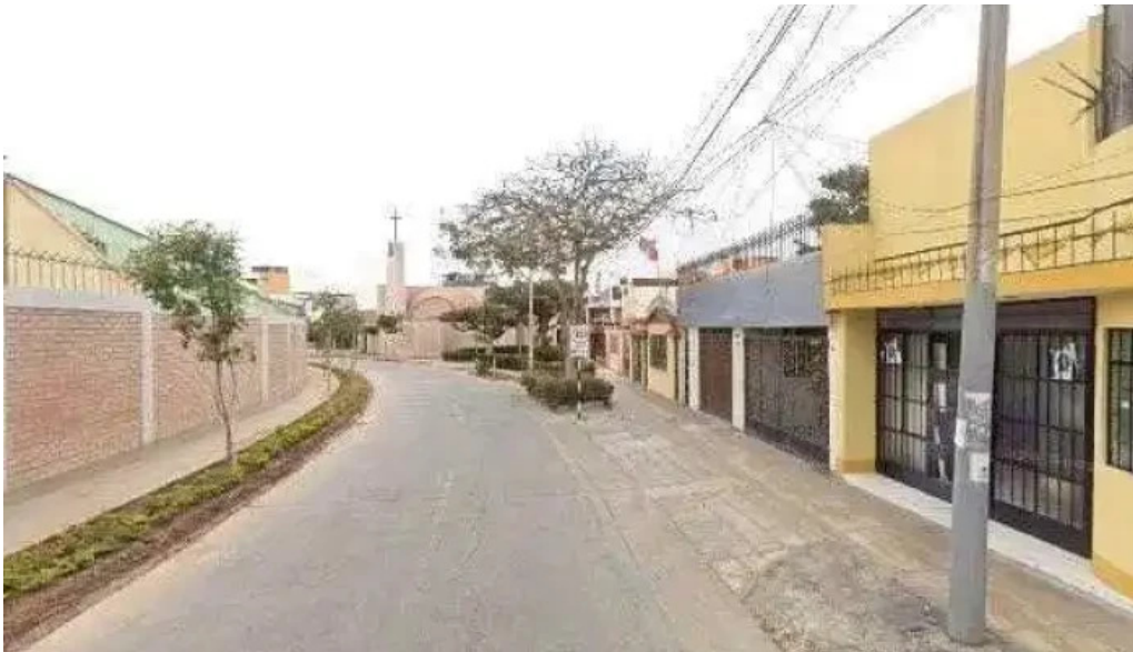
Farmacia maria auxiliadora fotosdeg