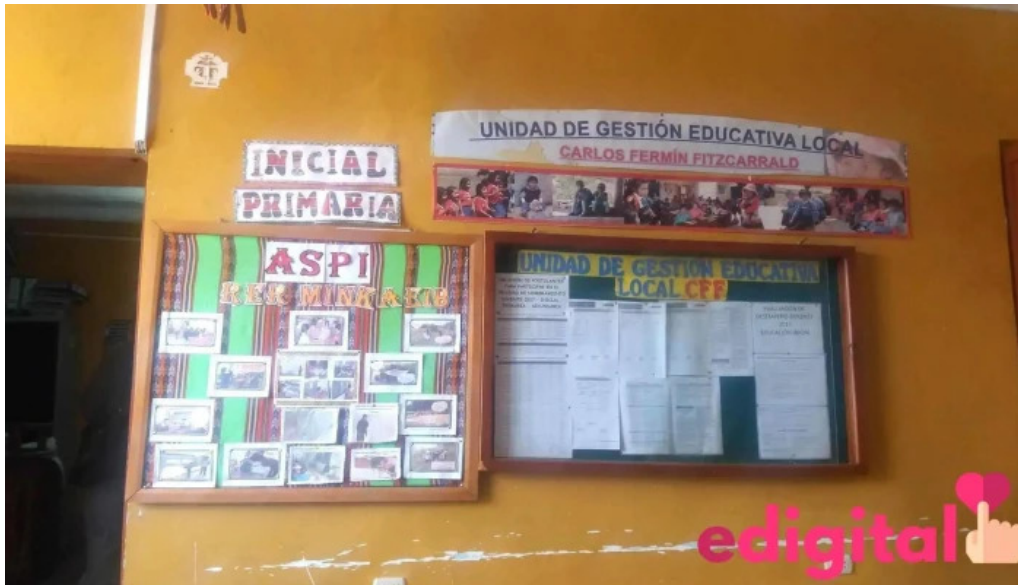
Unidad de gestion educativa local de carlos fermin fitzcarrald descuentos