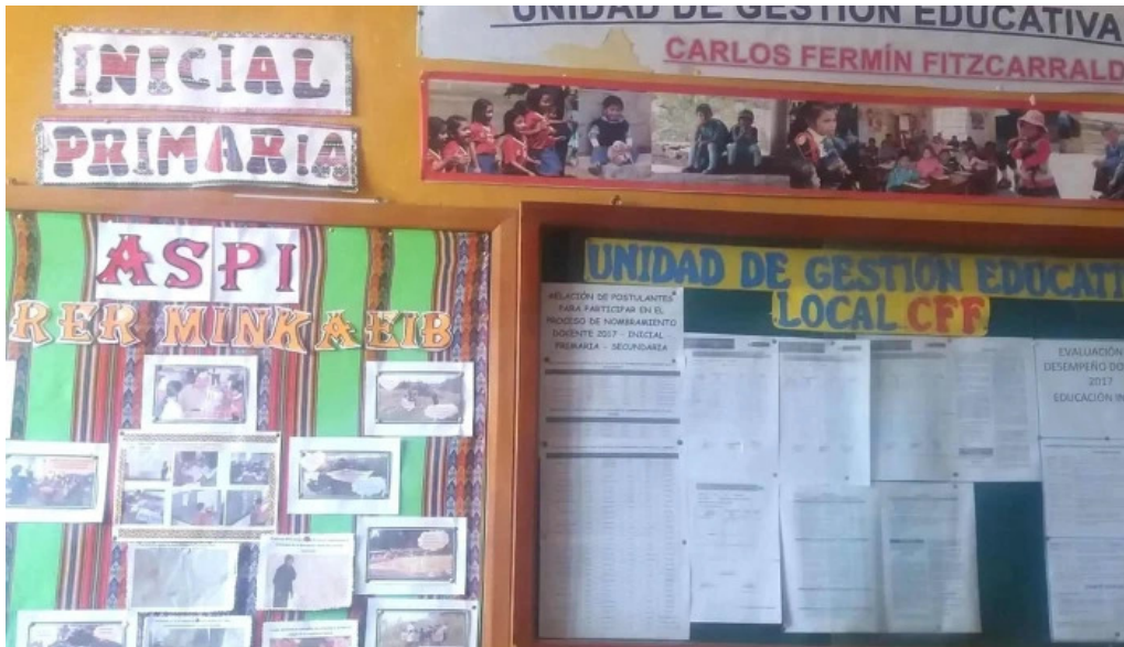
Unidad de gestión educativa local de carlos fermin fitzcarrald san luis