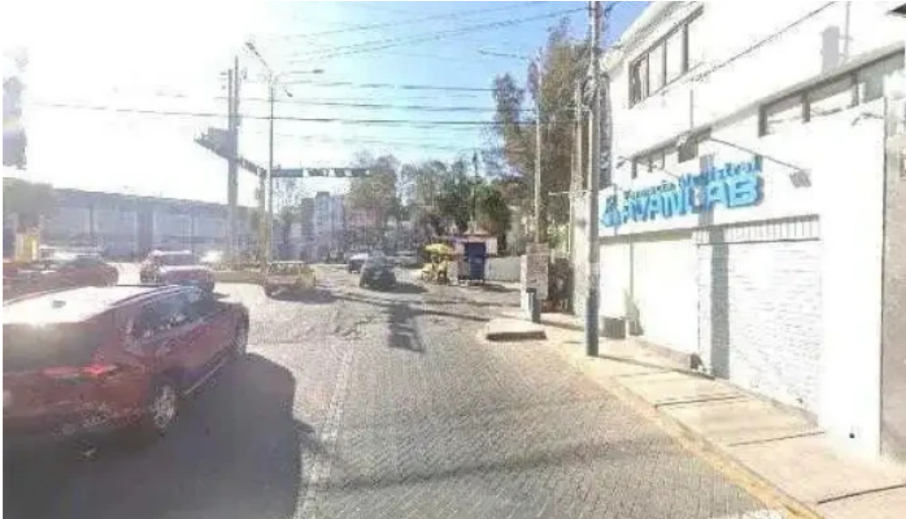
Farmacia magistral avanlab arequipa catalogo