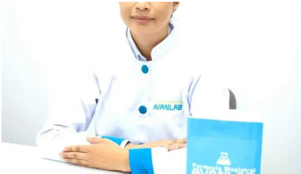
Farmacia magistral avanlab arequipa del propietario