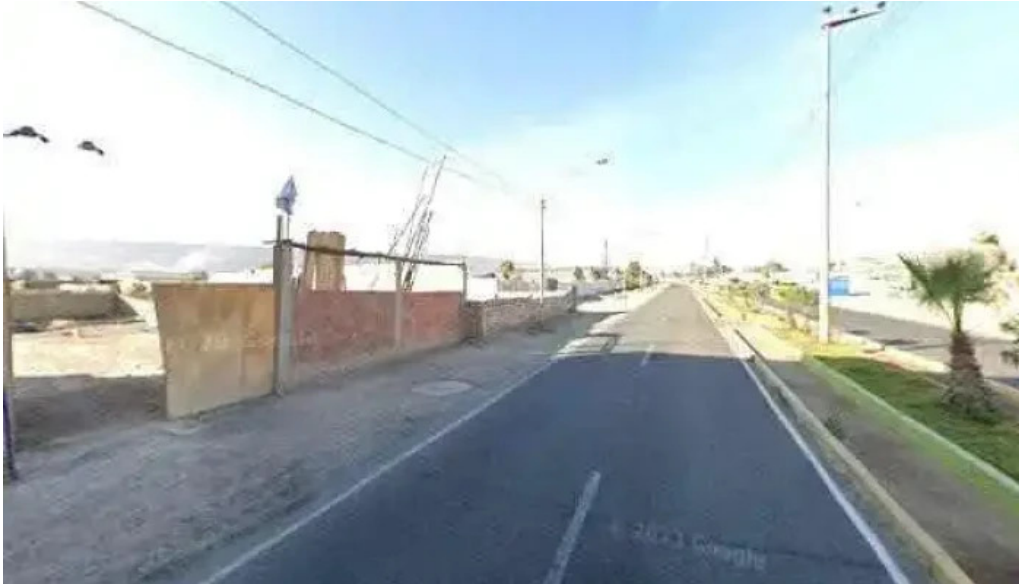
Farmacia morenita de guadalupe sitio web