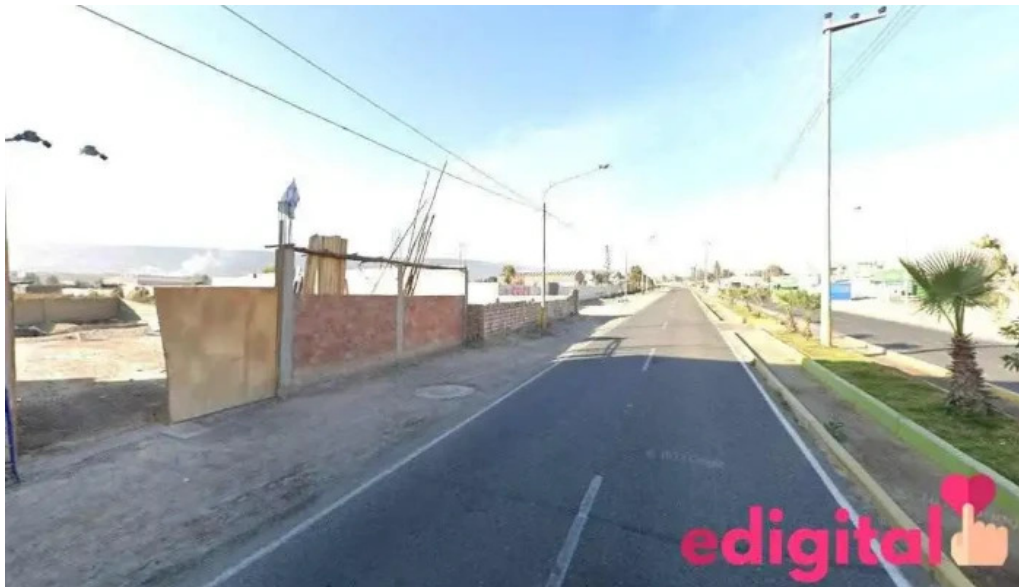
Farmacia morenita de guadalupe tacna