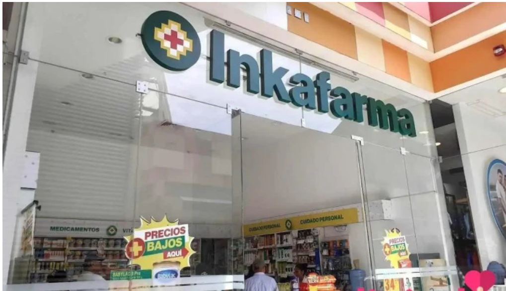
Inkafarma san vicente de canete