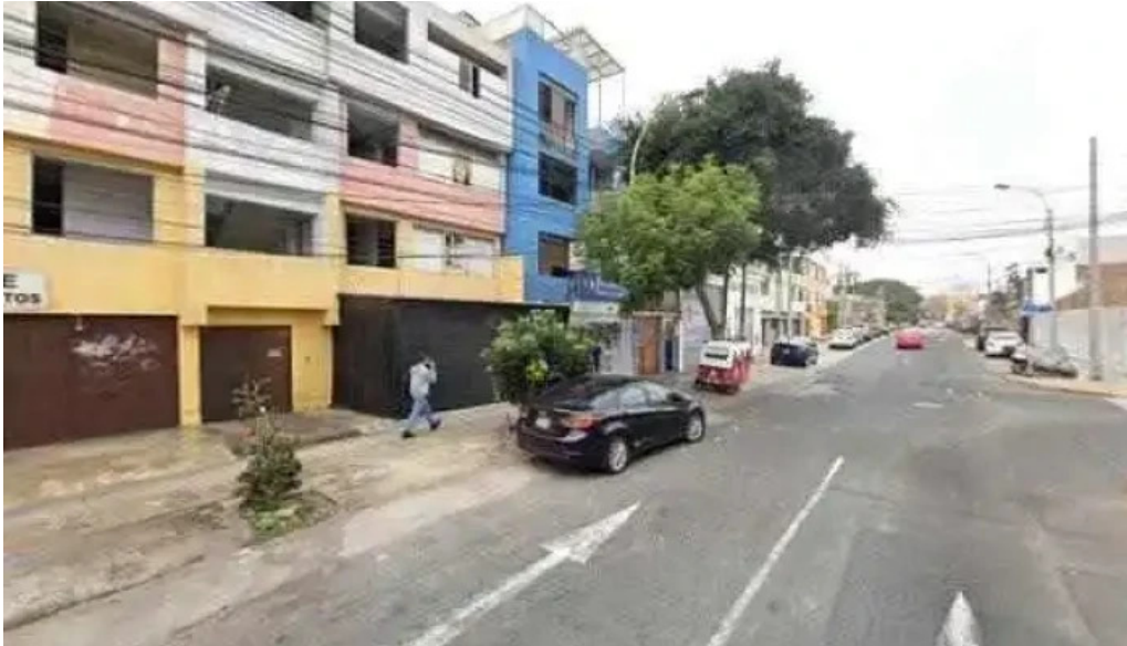
Farmacia santa florencia descuentosdeg