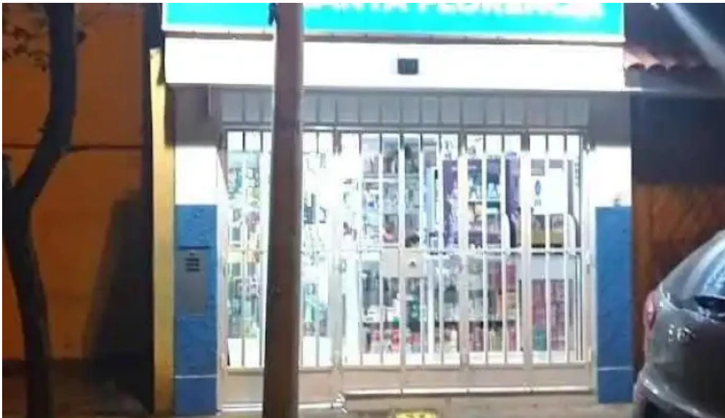
Farmacia santa florencia san miguel