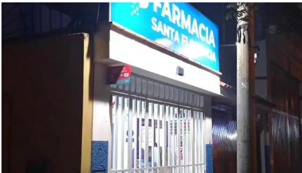
Farmacia santa florencia del propietario