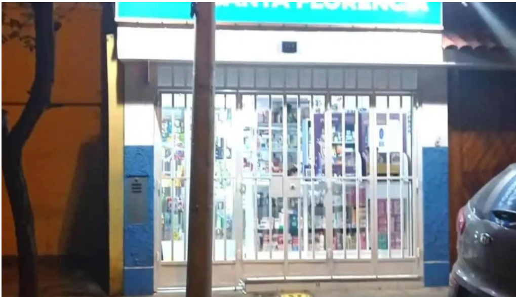
Farmacia santa florencia descuentos