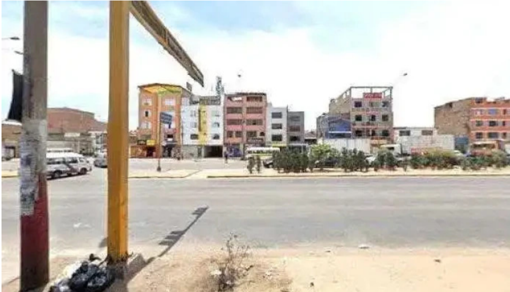
Inkafarma canta callao 4 opiniones