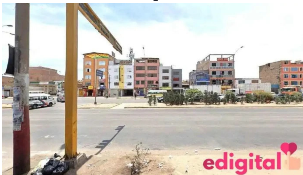
Inkafarma canta callao 4 san martin de porres