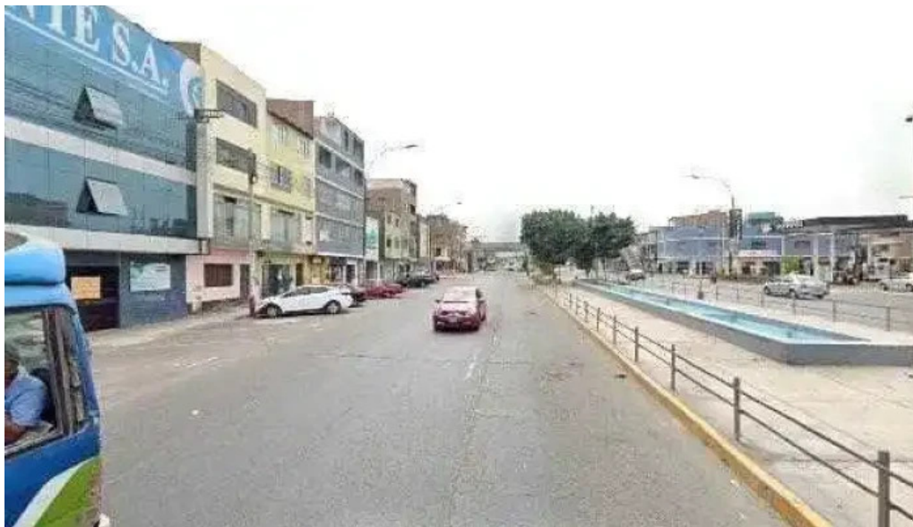
Farmacia dermaquim donde