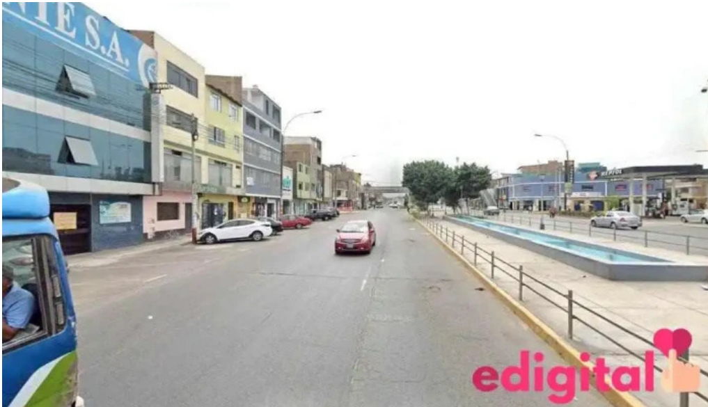
Farmacia dermaquim san martin de porres