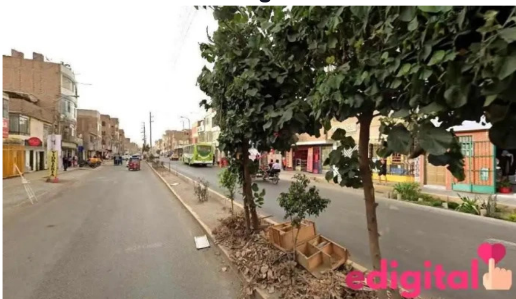
Botica san martin de porres