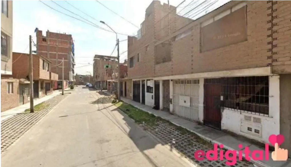
Botica j k pharma san martin de porres