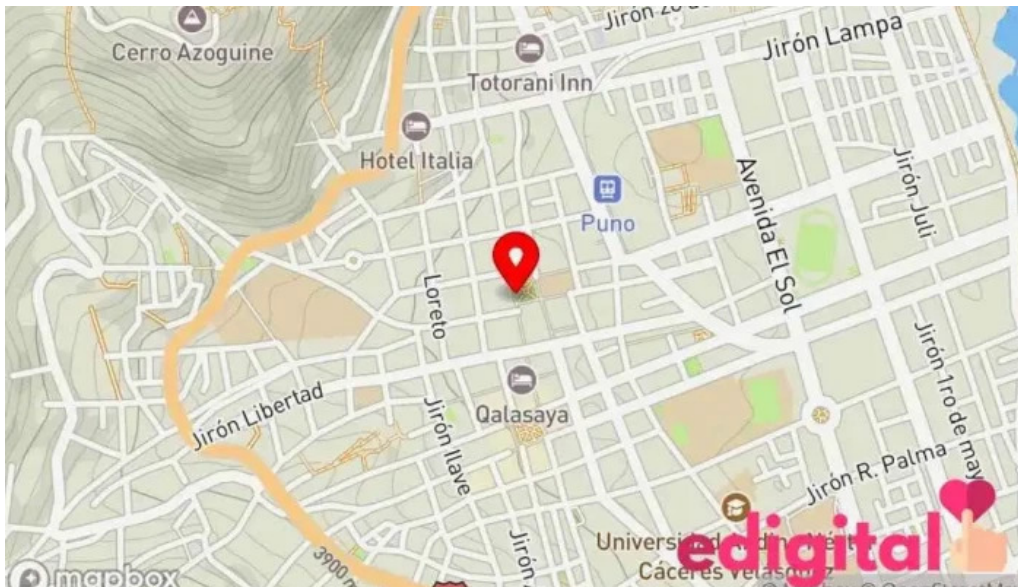
Boticas peru mapa