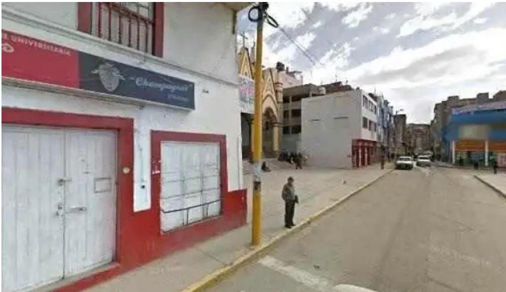
Boticas peru abierto ahora