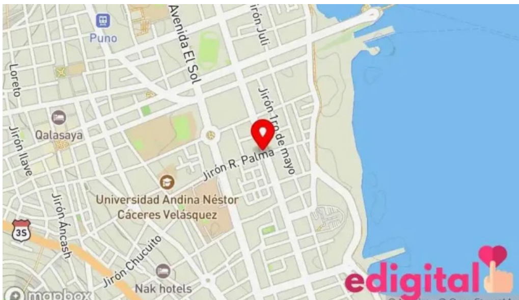
Botica santisima cruz ii mapa