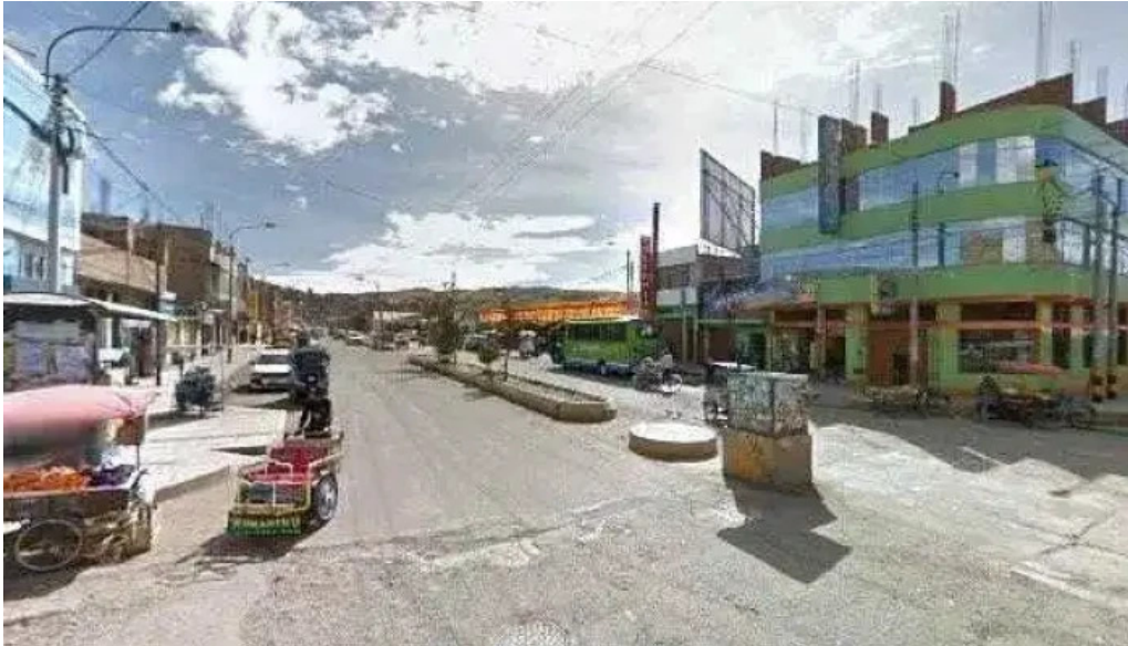
Botica santísima cruz ii horario