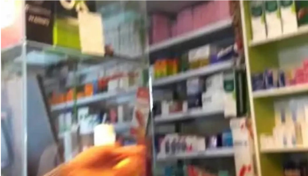
Botica santisima cruz ii puno