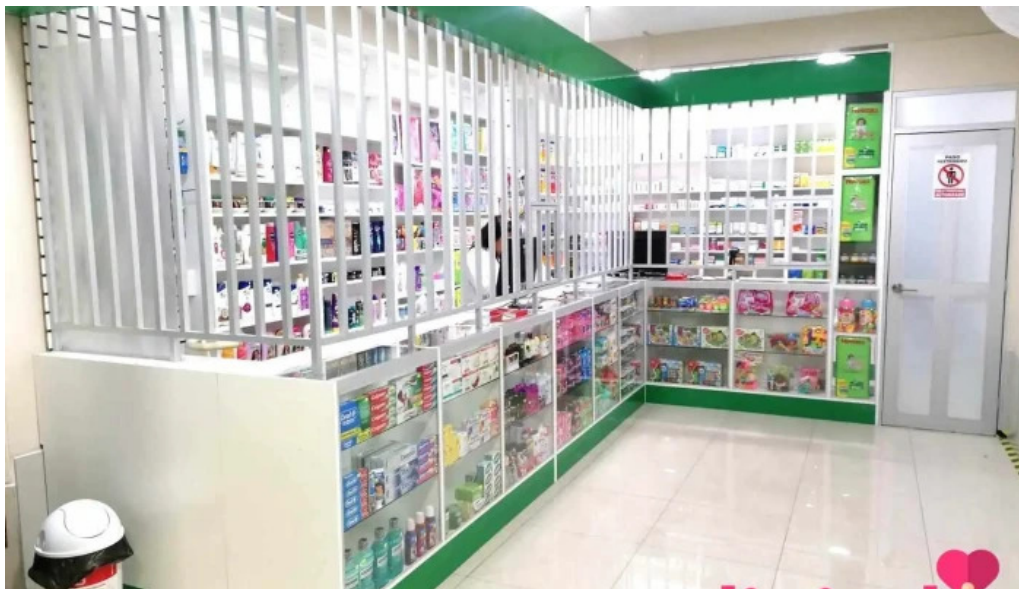
Farmacias peru del propietario