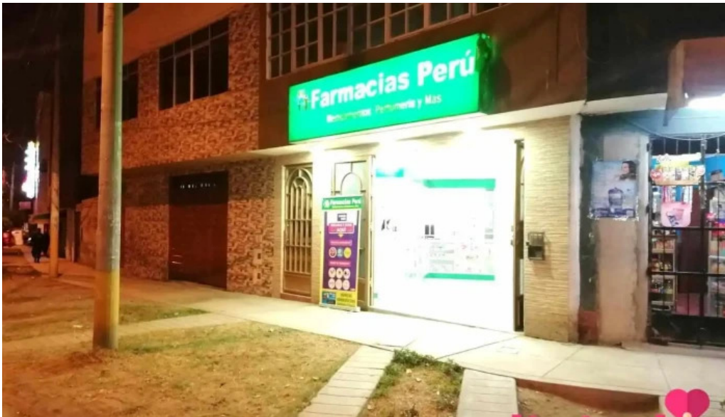
Farmacias peru comentarios