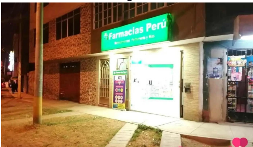
Farmacias peru puente piedra