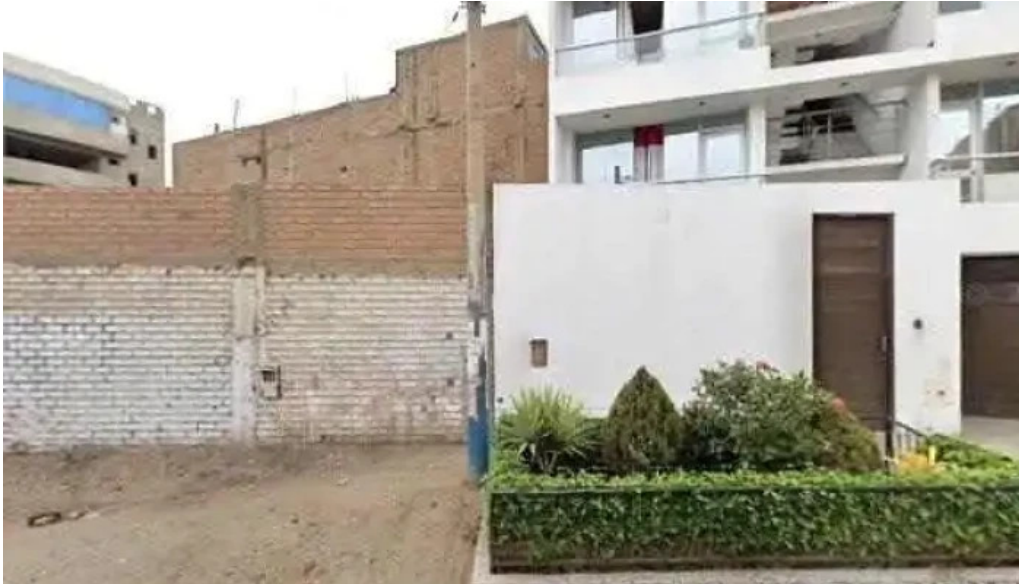
Farmacias peru comentariosdeg