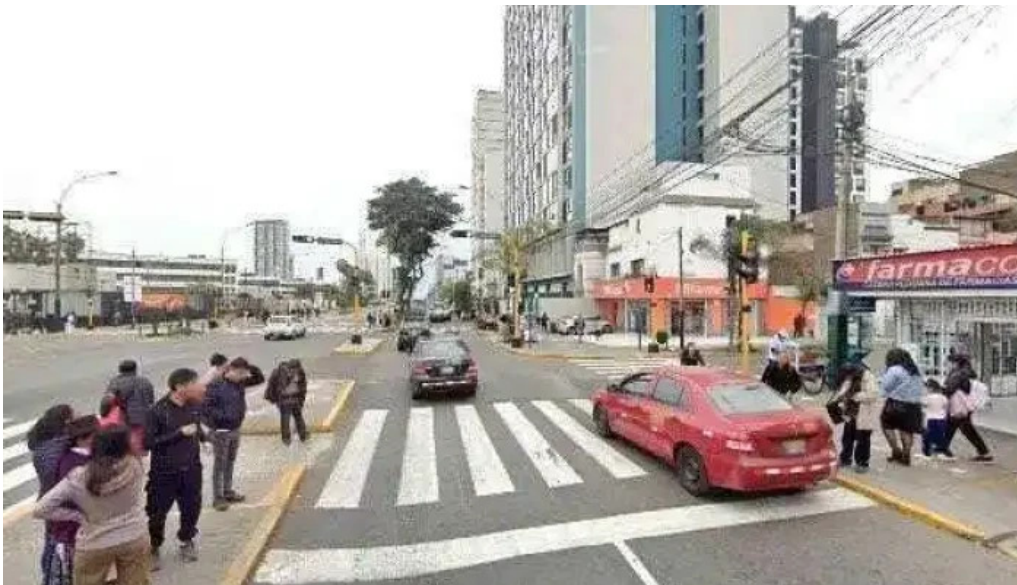
Farmacia lucero puntajedeg