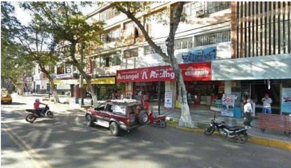
Boticas peru sitio web