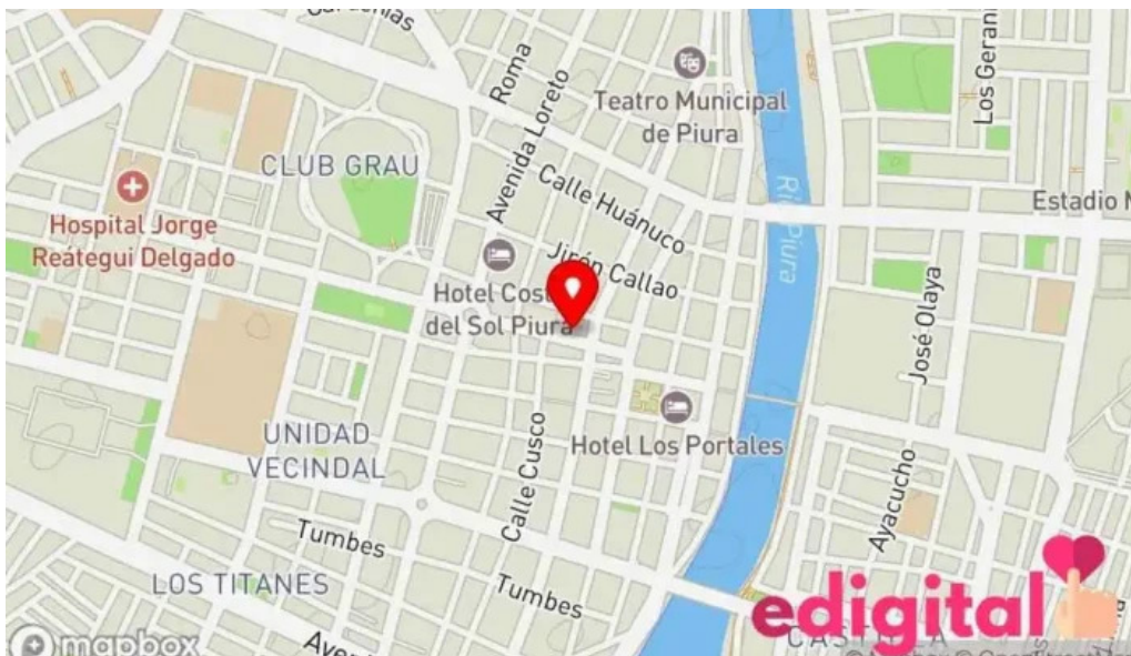
Boticas peru mapa