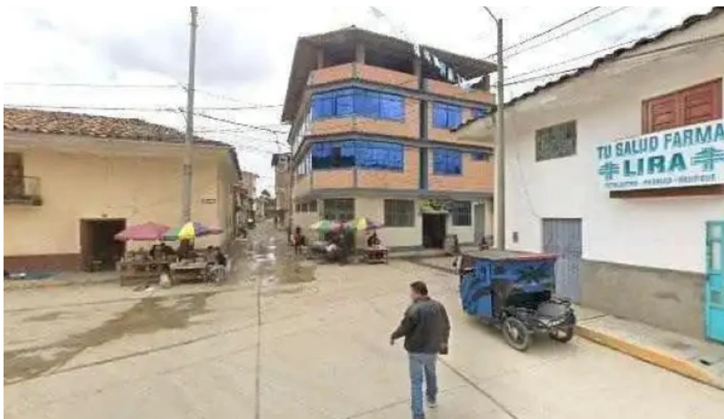
Tu salud farma lira comentarios