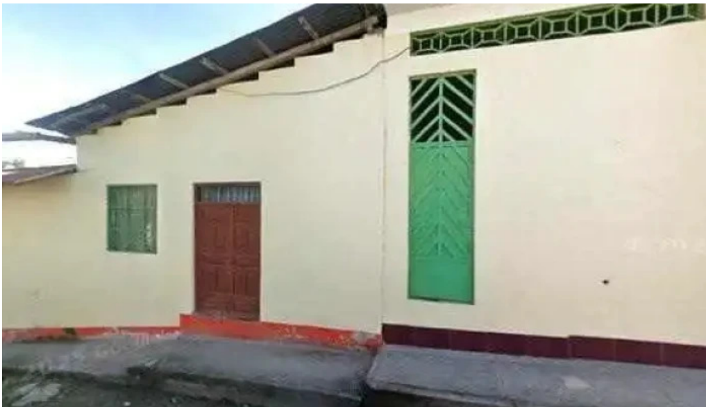
Botica central precios