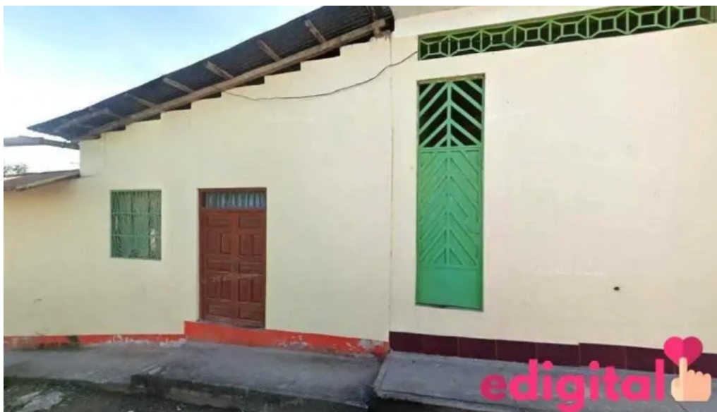
Botica central naranjos alto