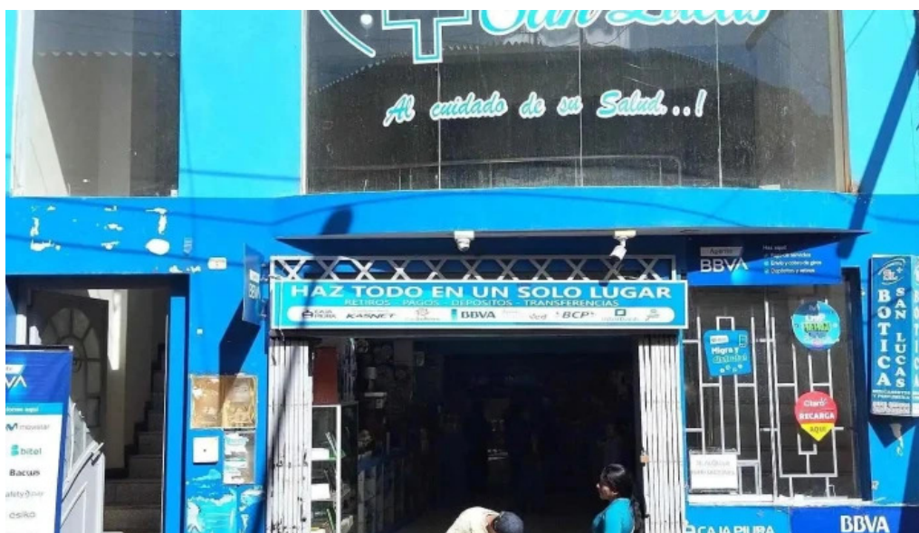
Botica san lucas multiservicios del propietario