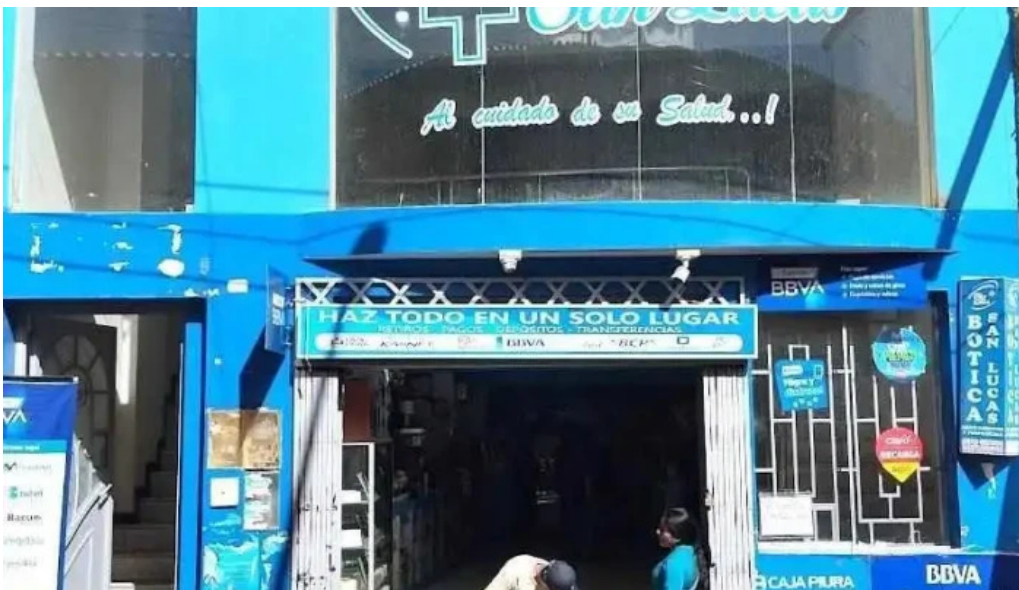
Botica san lucas multiservicios montero