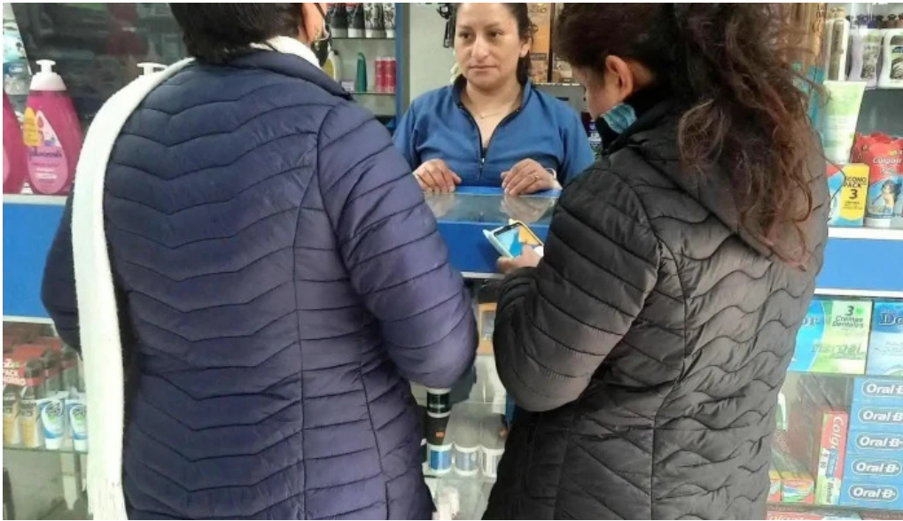
Botica san lucas multiservicios opiniones