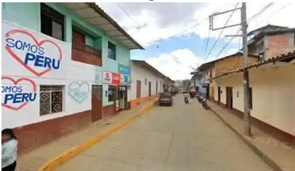
Botica mi salud preciosdeg