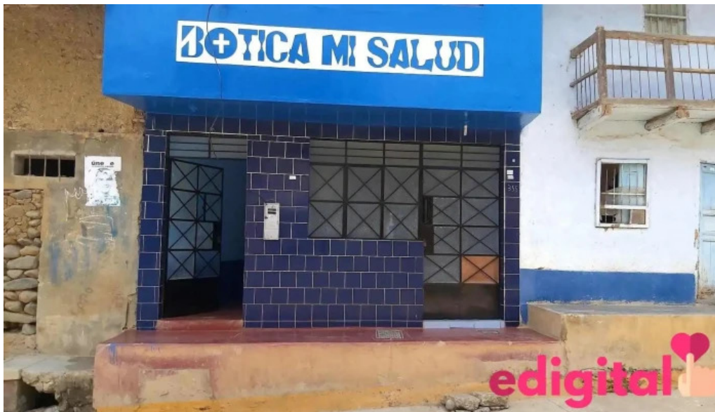
Botica mi salud montero