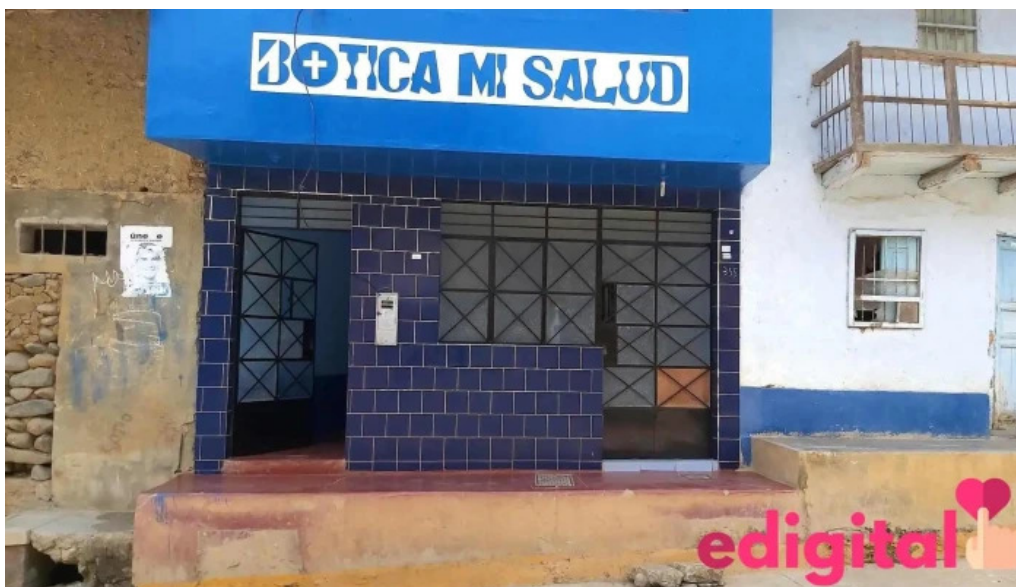
Botica mi salud precios