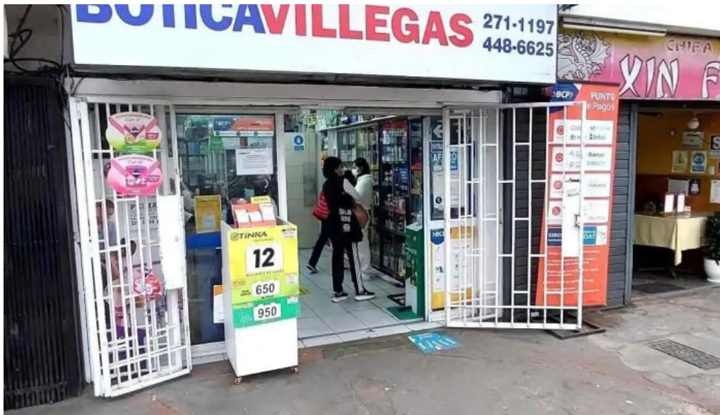
Botica villegas opiniones