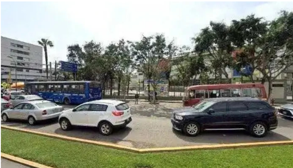
Botica villegas opinionesdeg