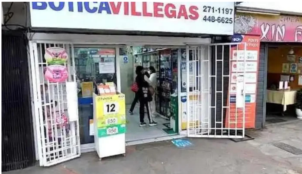
Botica villegas miraflores