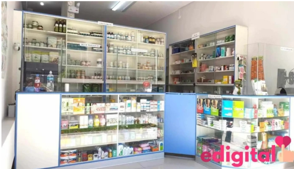
Botica integral namaste donde