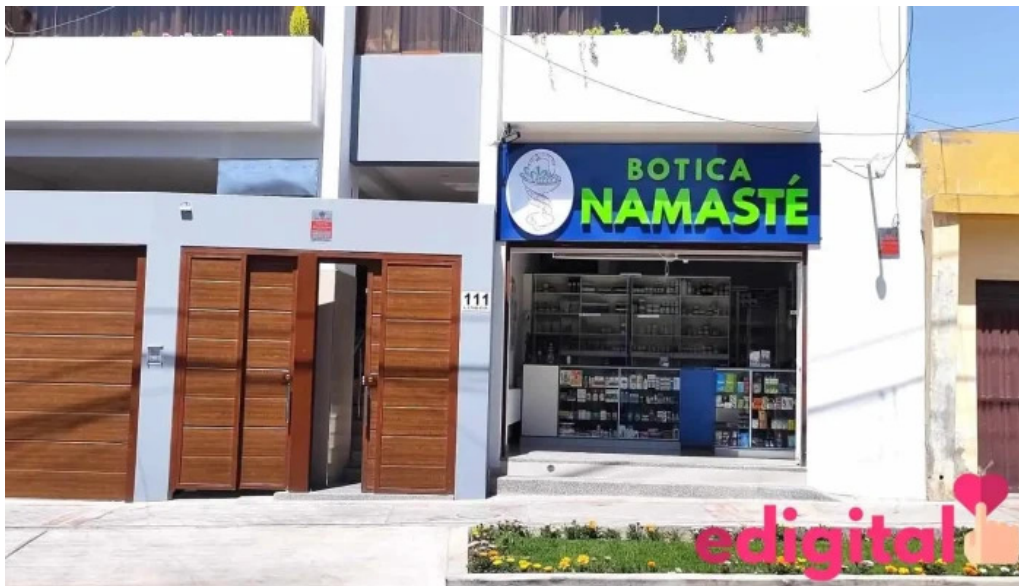
Botica integral namaste del propietario