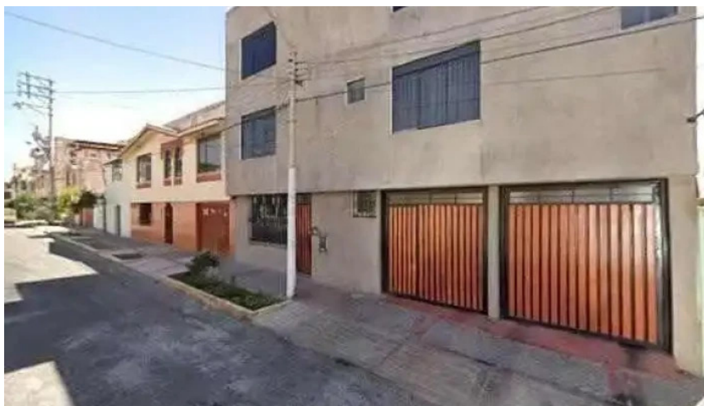
Botica integral namaste dondedeg