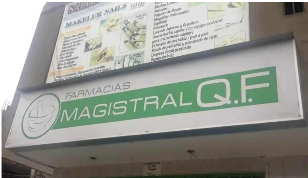
Qf farmacia magistral los olivos los olivos