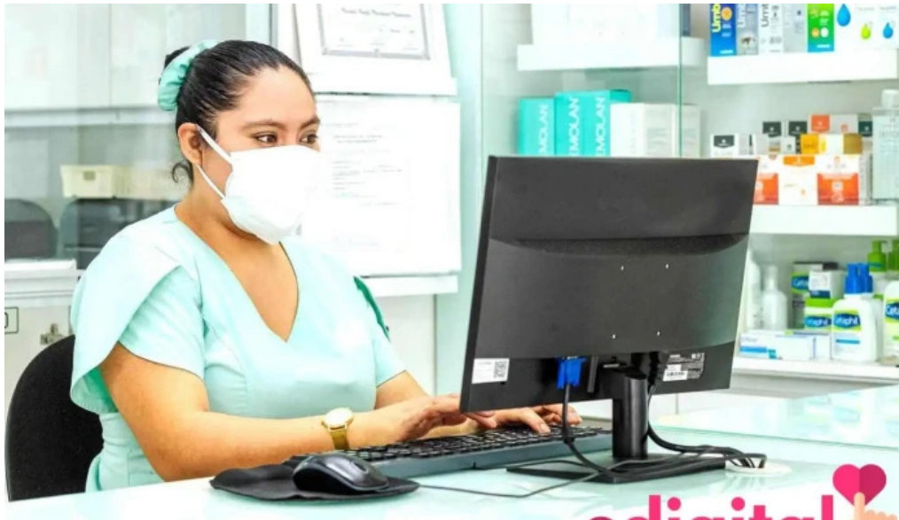
Qf farmacia magistral los olivos del propietario