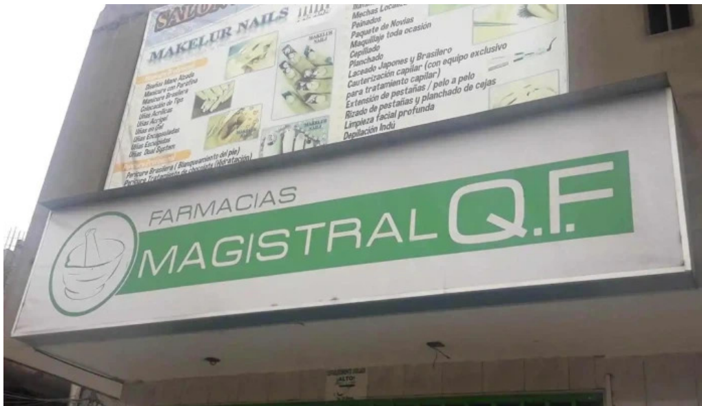
Qf farmacia magistral los olivos videos