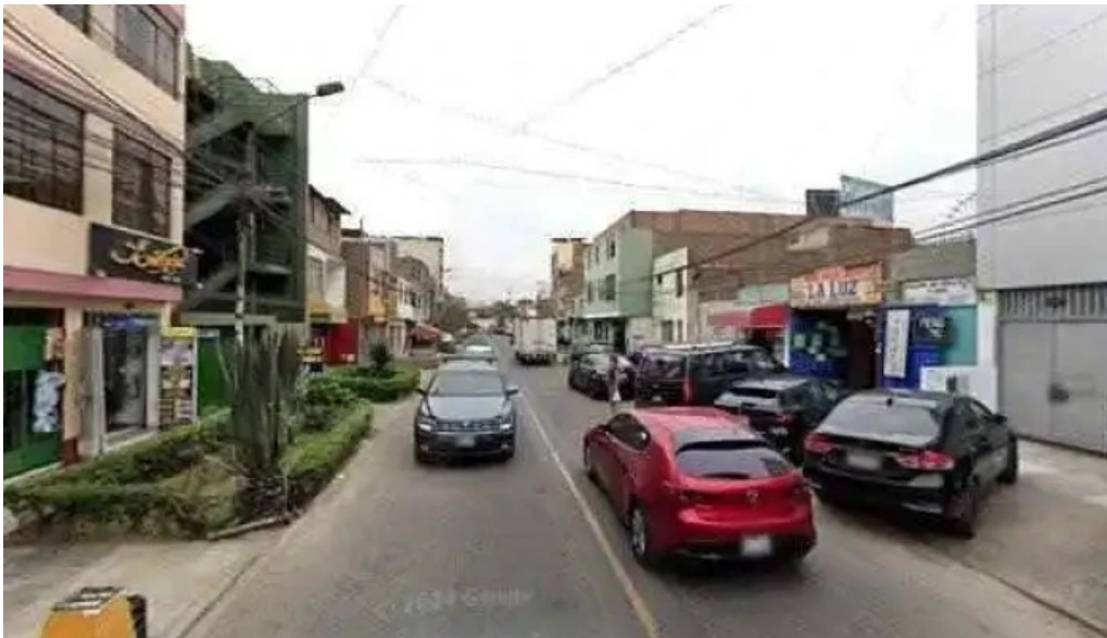
Qf farmacia magistral los olivos videosdeg