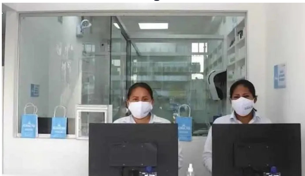
Farmacia magistral avanlab los olivos los olivos