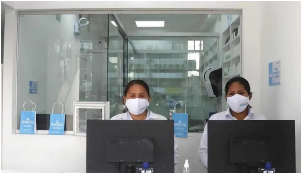
Farmacia magistral avanlab los olivos precios