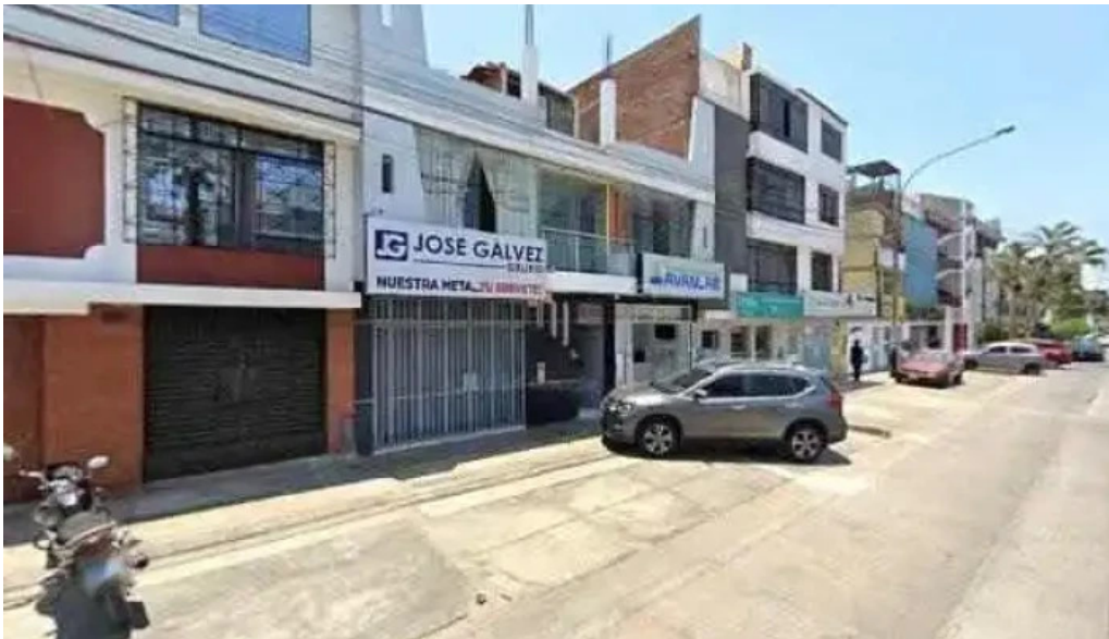
Farmacia magistral avanlab los olivos preciosdeg