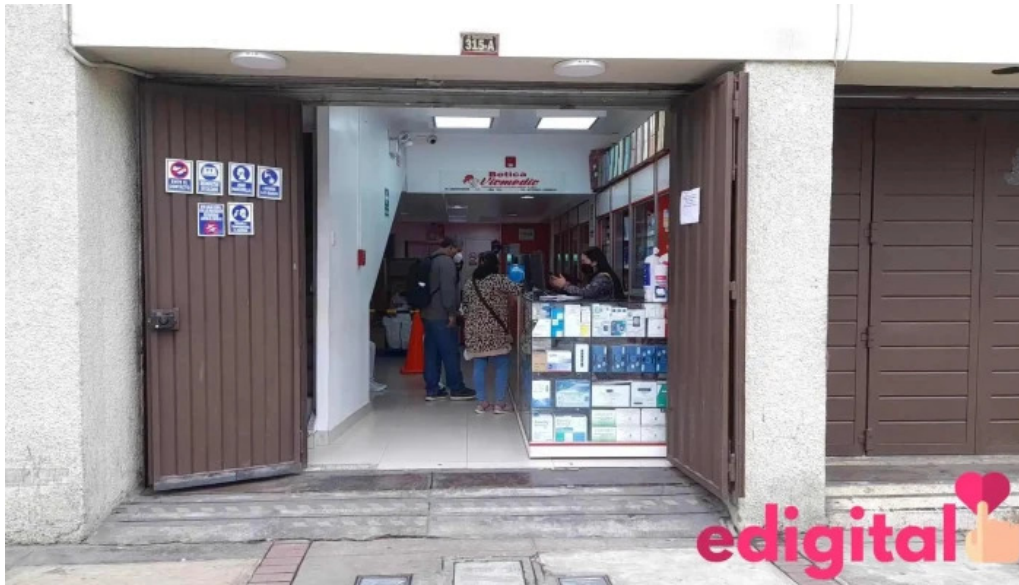
Medical farmaceutica sac lima