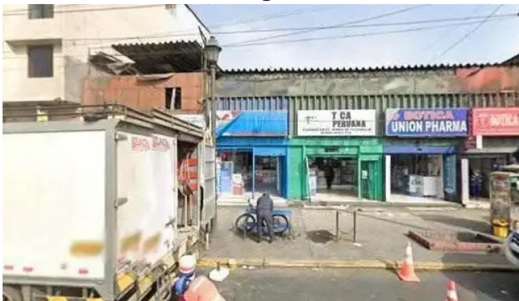
Lyn farma precios