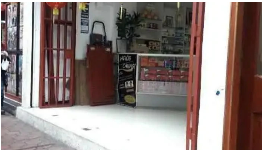
Global farmaceutica lima