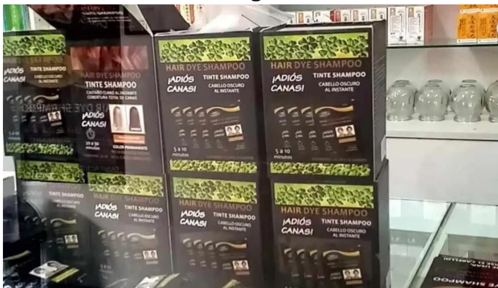
Global farmaceutical videos