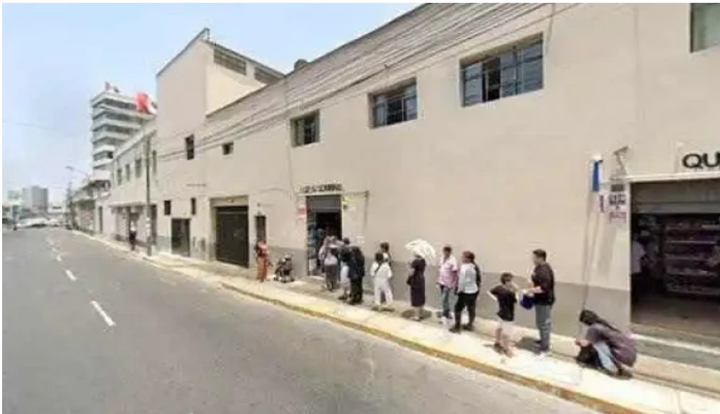
Farmaderm quilca puntaje