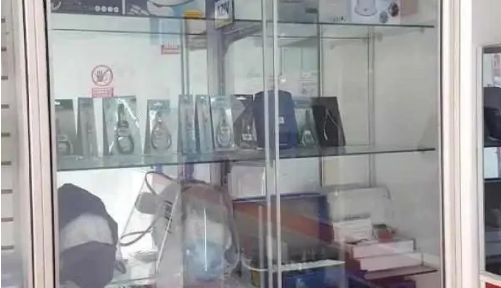
Farmaderm quilca lima