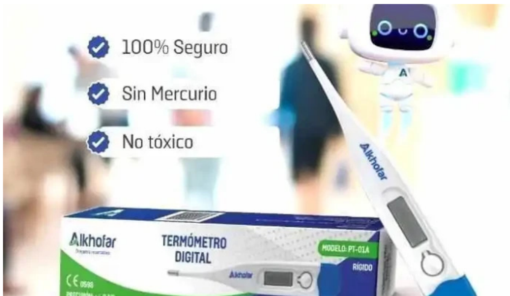
Drogueria corporacion yuadi medic eirl lima