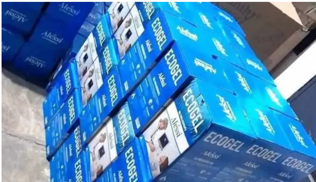
Drogueria corporacion yuadi medic eirl del propietario