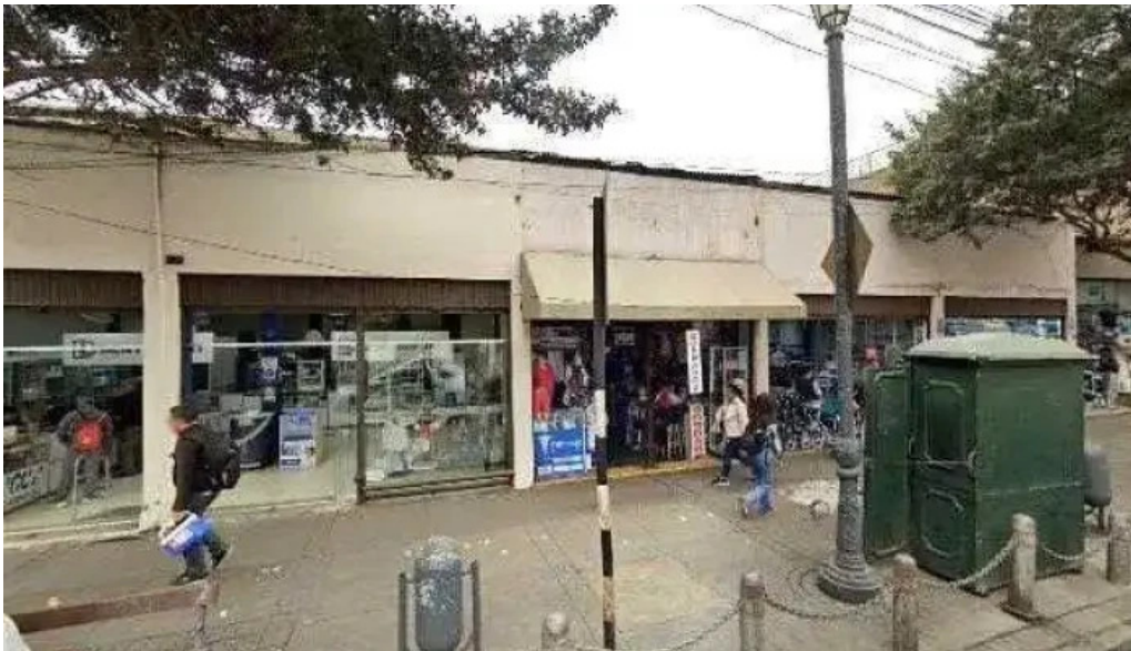
Drogueria corporacion yuadi medic eirl sitio web