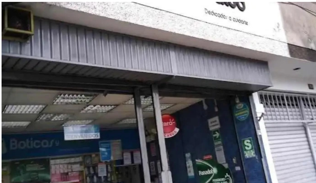
Boticas y salud brena 5 lima