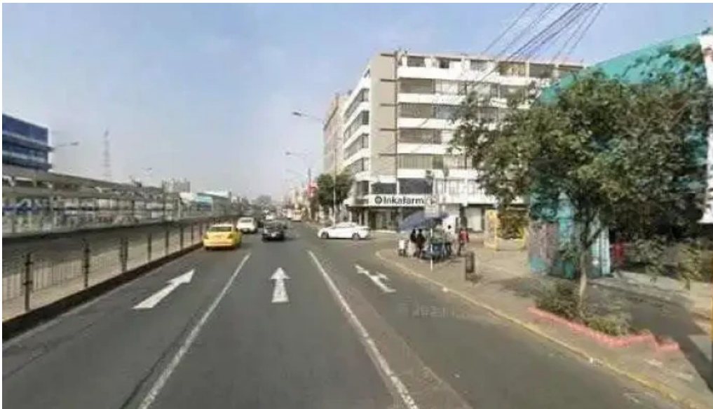
Boticas y salud breña 5 sitio web