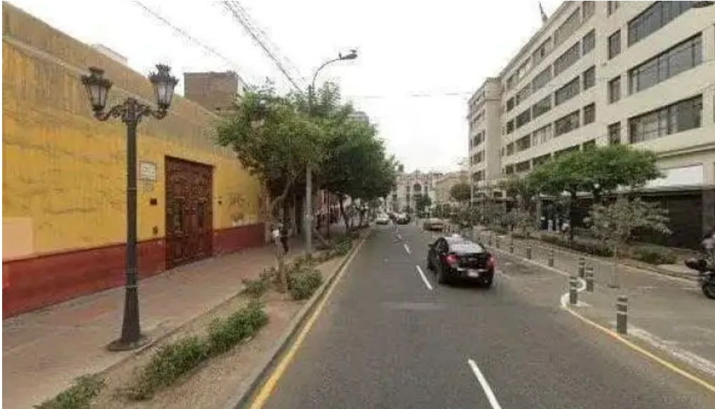
Boticas peru direccion