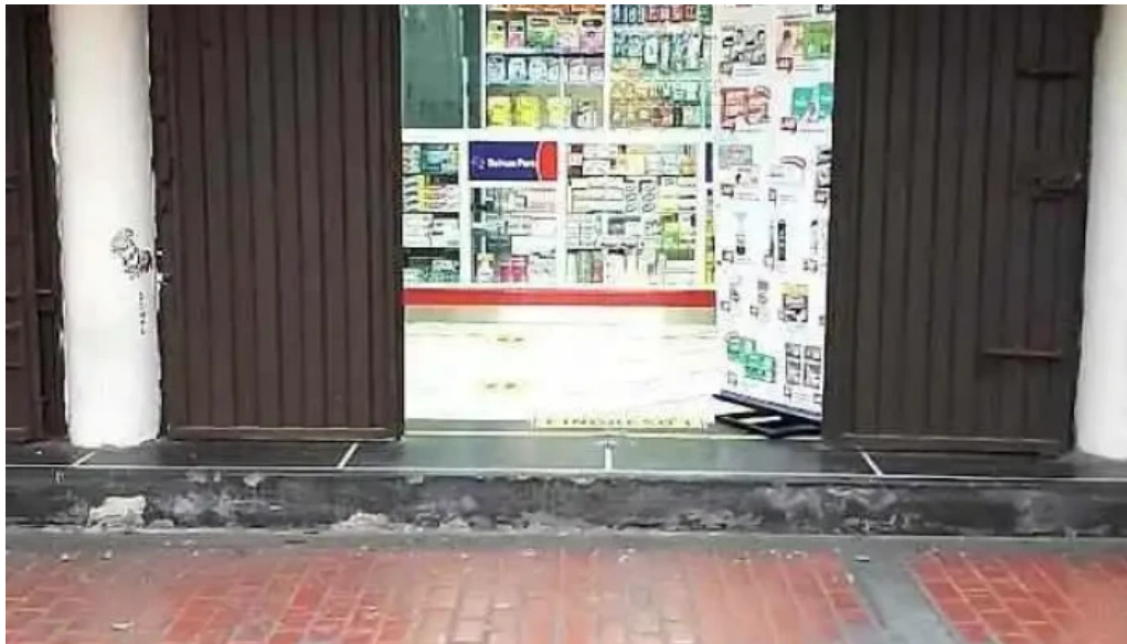
Boticas peru lima