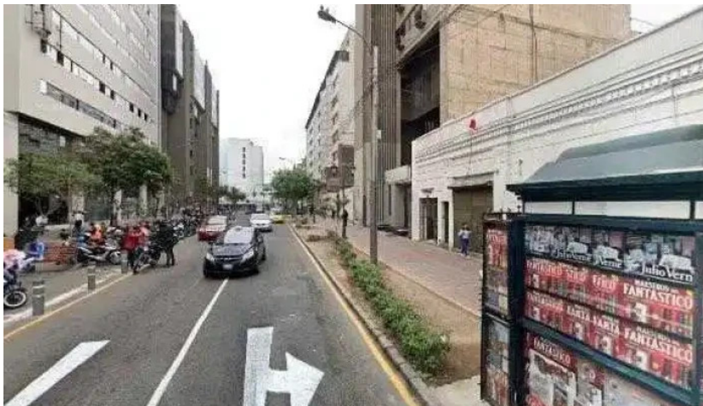
Boticas farmacentro como llegar