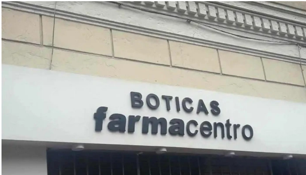
Boticas farmacentro lima