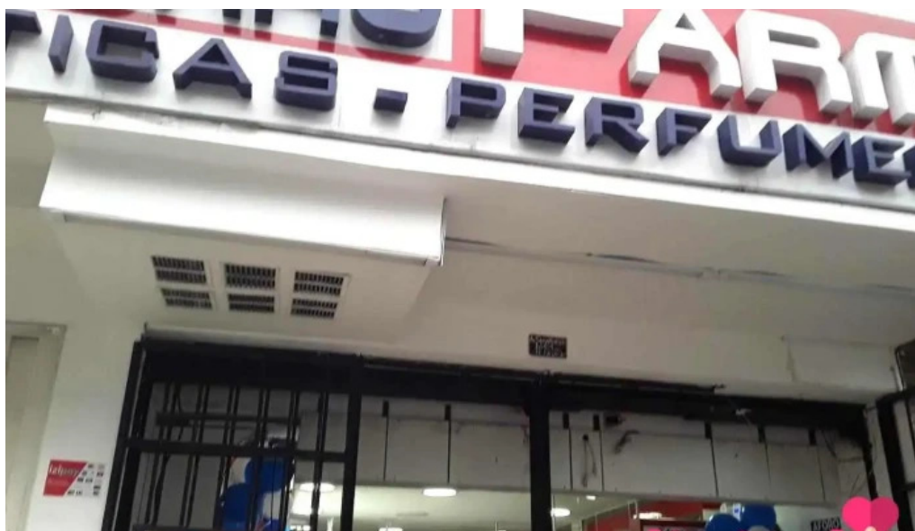
Boticas ahorro farma lima