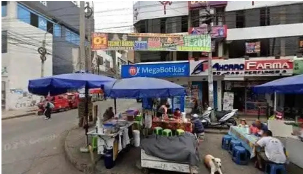
Boticas ahorro farma descuentosdeg