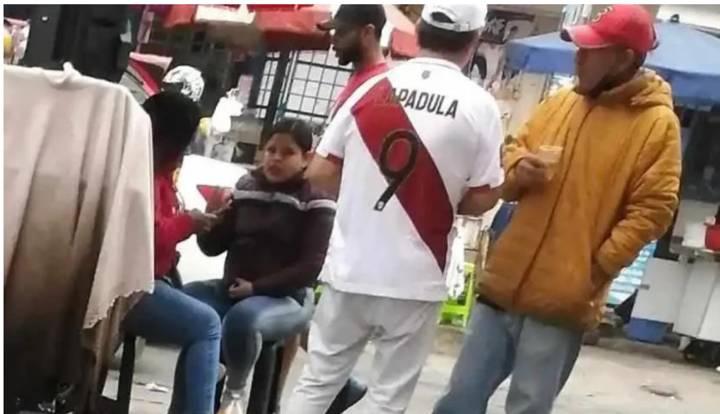
Boticas ahorro farma descuentos