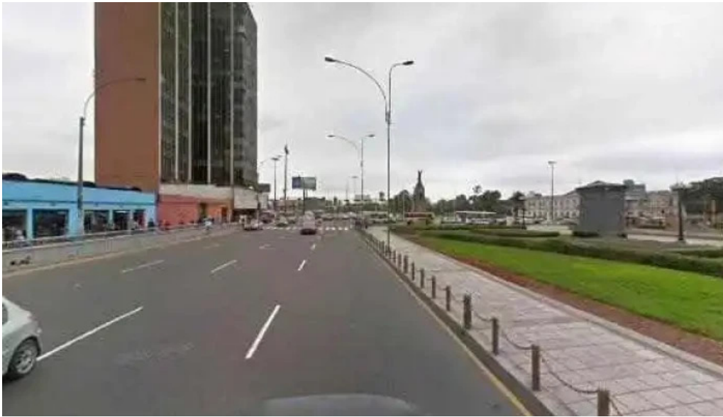
Botica nova salud descuentos