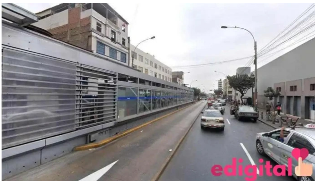
Botica melyfarma lima