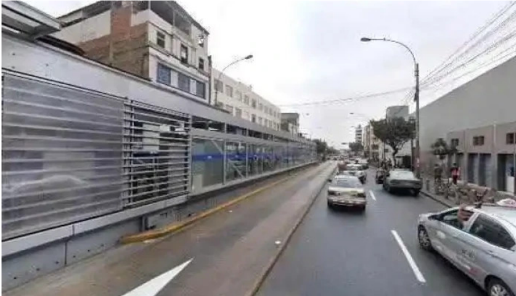
Botica melyfarma promocion