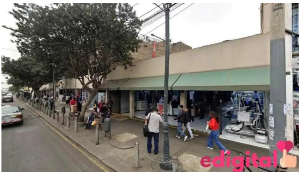
Botica jamesie lima