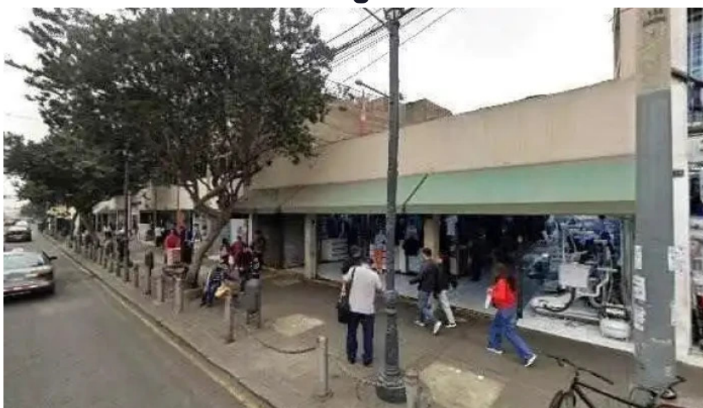
Botica jamesie promocion