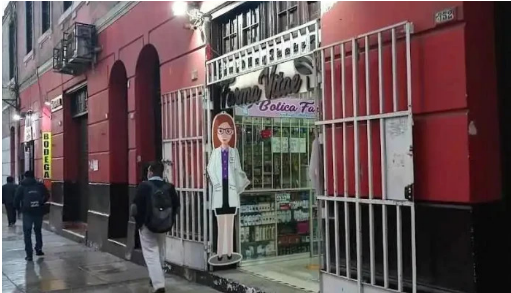
Botica farmavitae lima