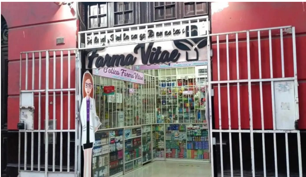
Botica farmavitae del propietario