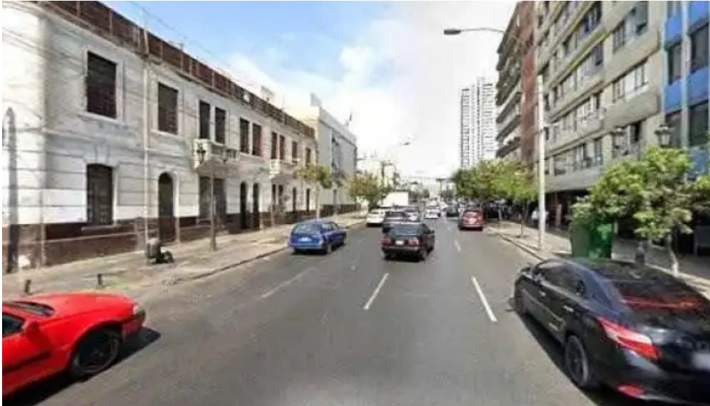
Botica farmavitae comentarios