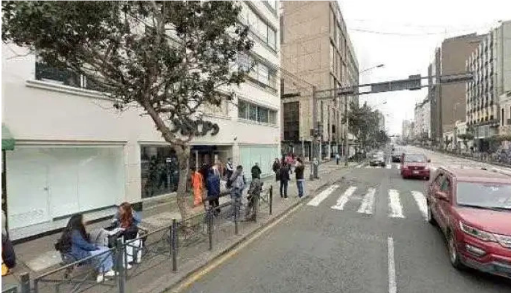
Botica dental pa arleen instagram