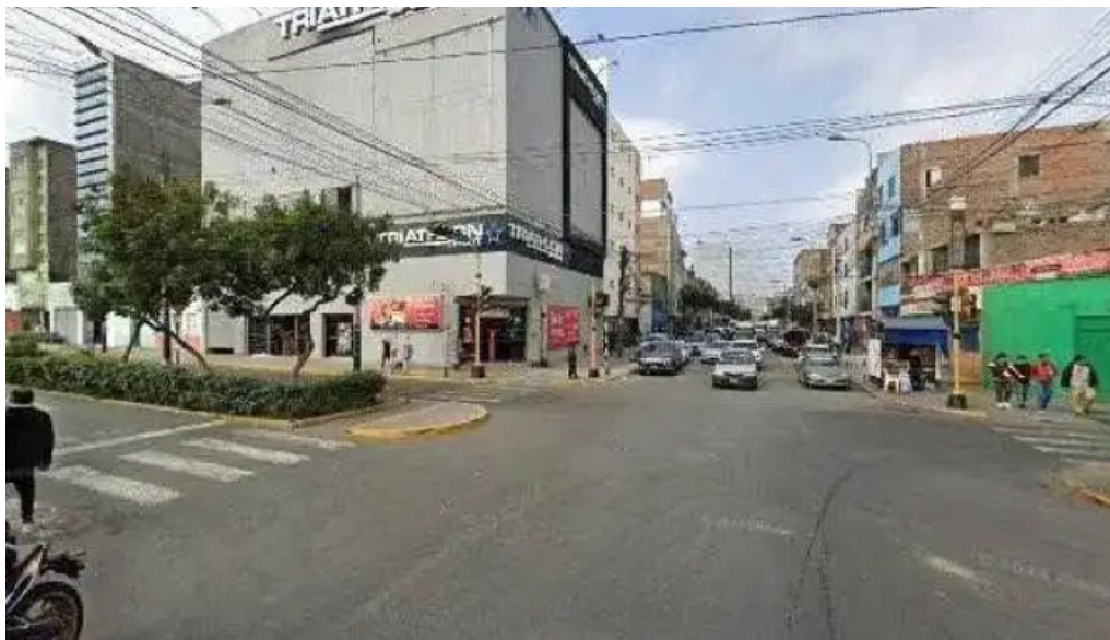
Botica aurelia la victoria abierto ahora