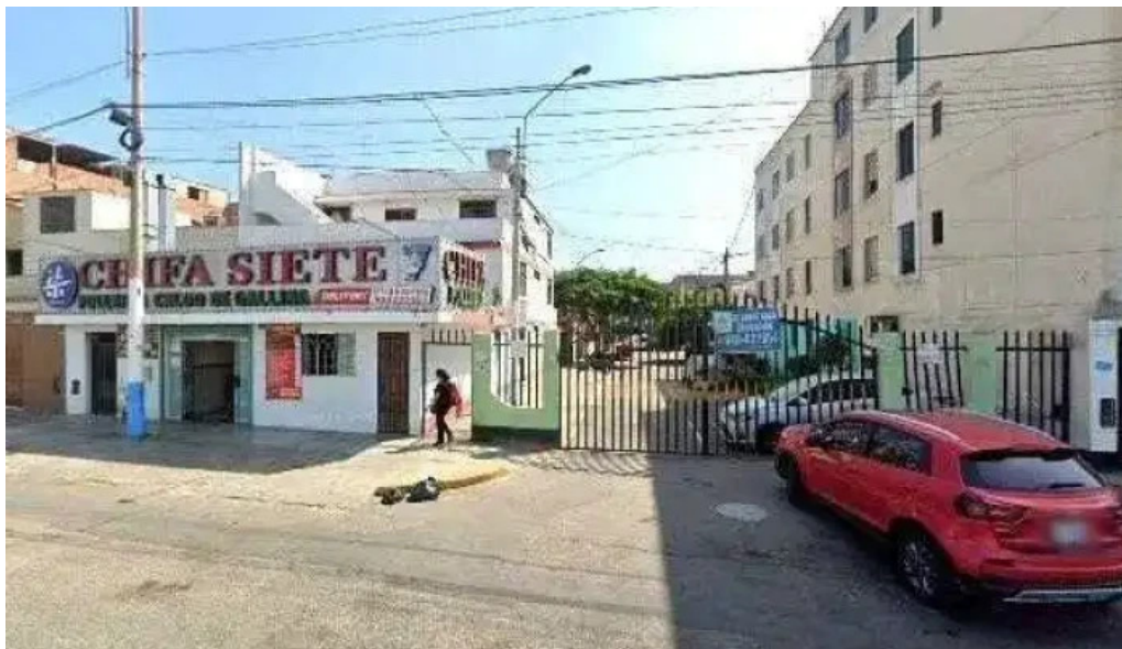
Neosalud callao descuentosdeg