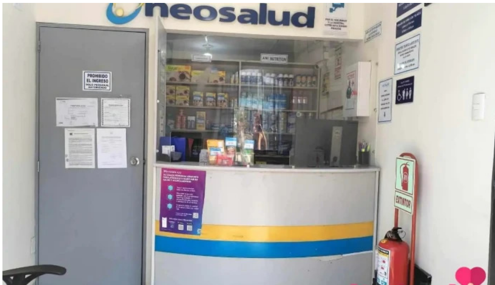
Neosalud callao descuentos