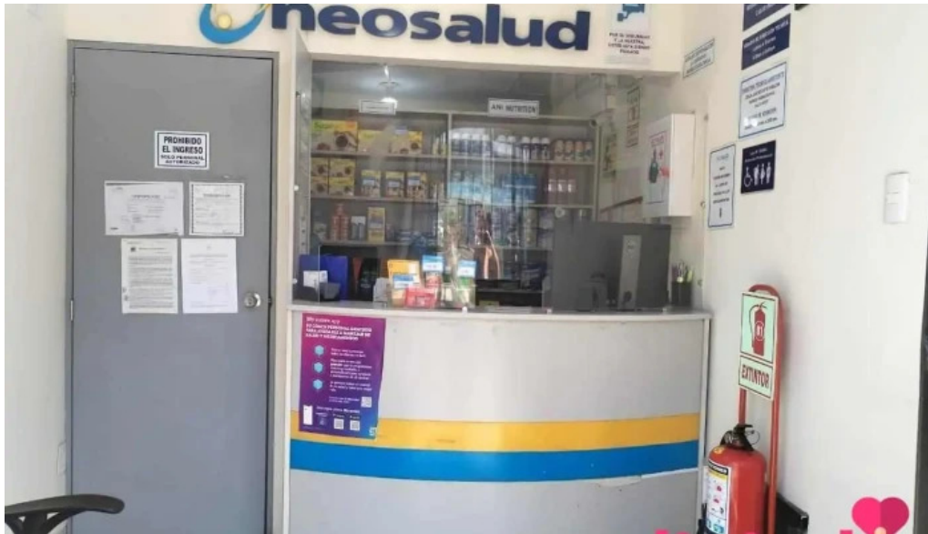
Neosalud callao la perla