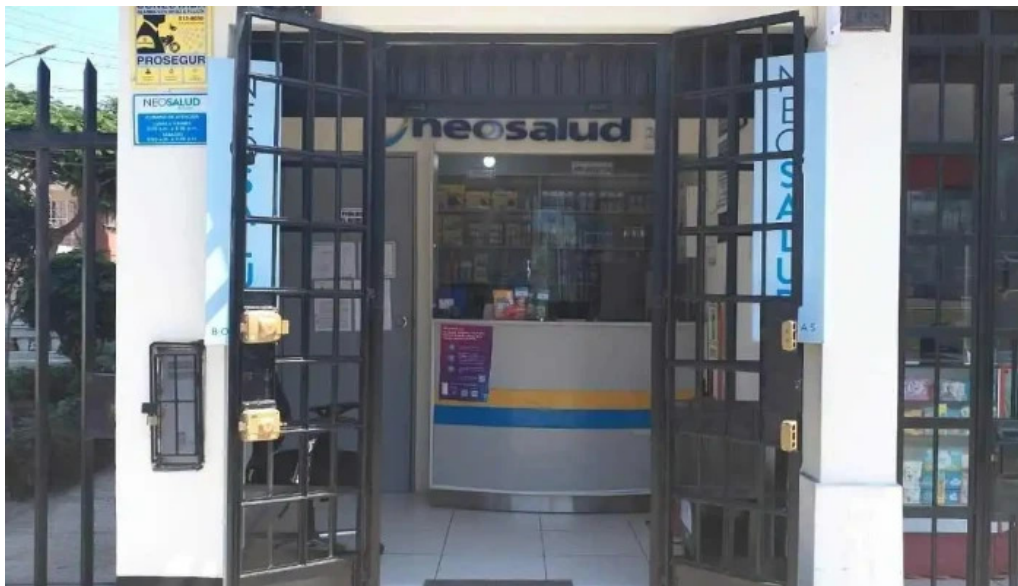
Neosalud callao del propietario