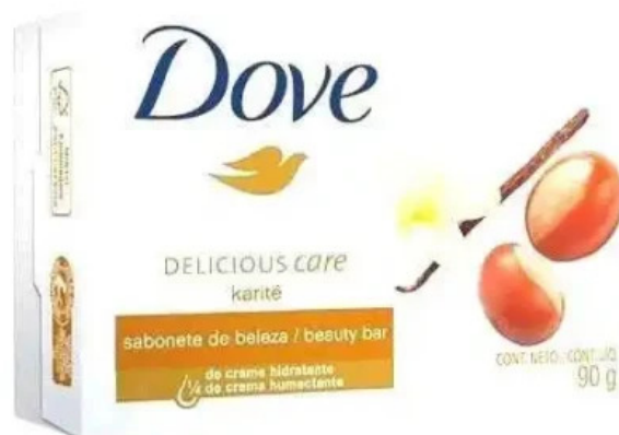
Botica pharmamed del propietario