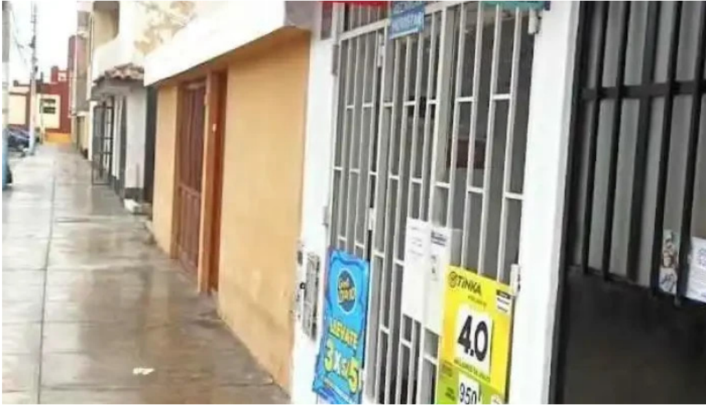
Botica pharmamed la perla