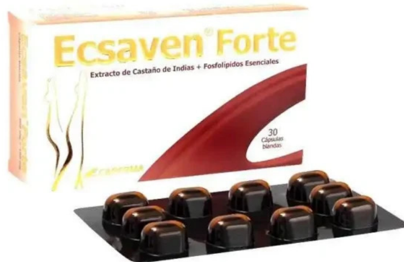
Botica pharmamed fotos