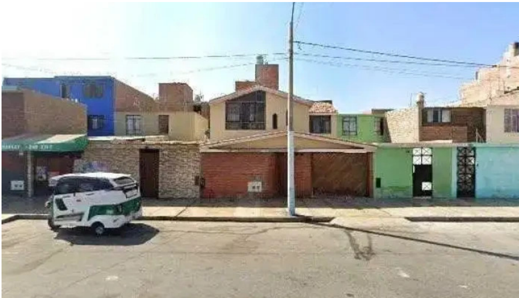
Botica pharmamed fotosdeg