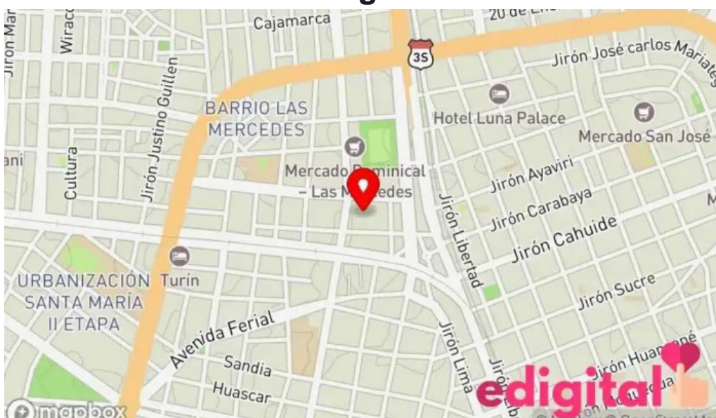
Farmacia yanacopa mapa