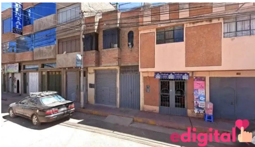
Farmacia yanacopa juliaca