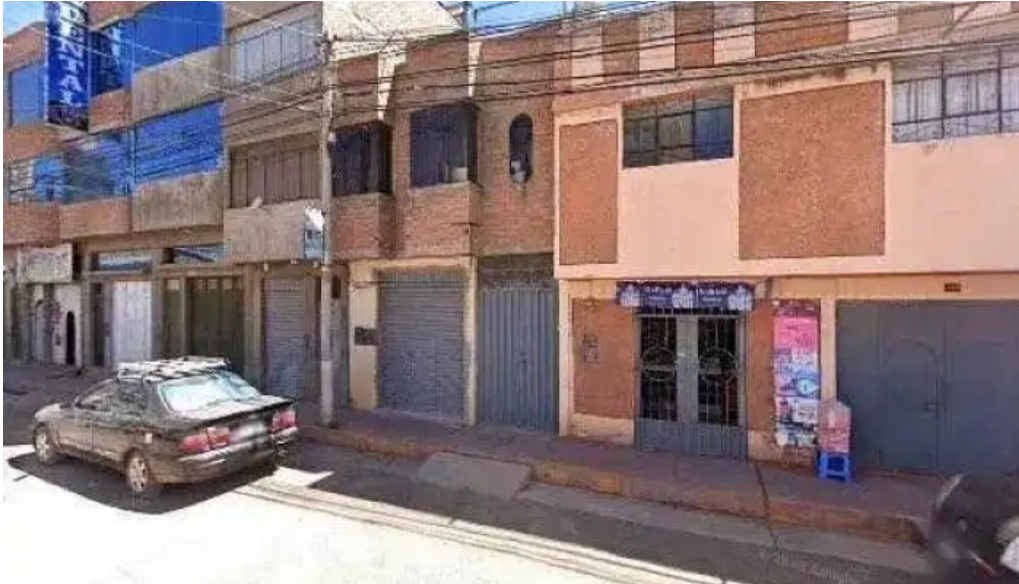
Farmacia yanacopa instagram