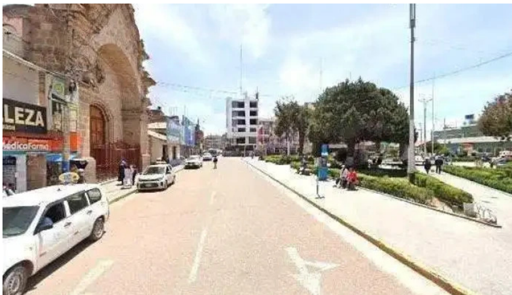
Farmacia medicafarma juliaca ubicacion