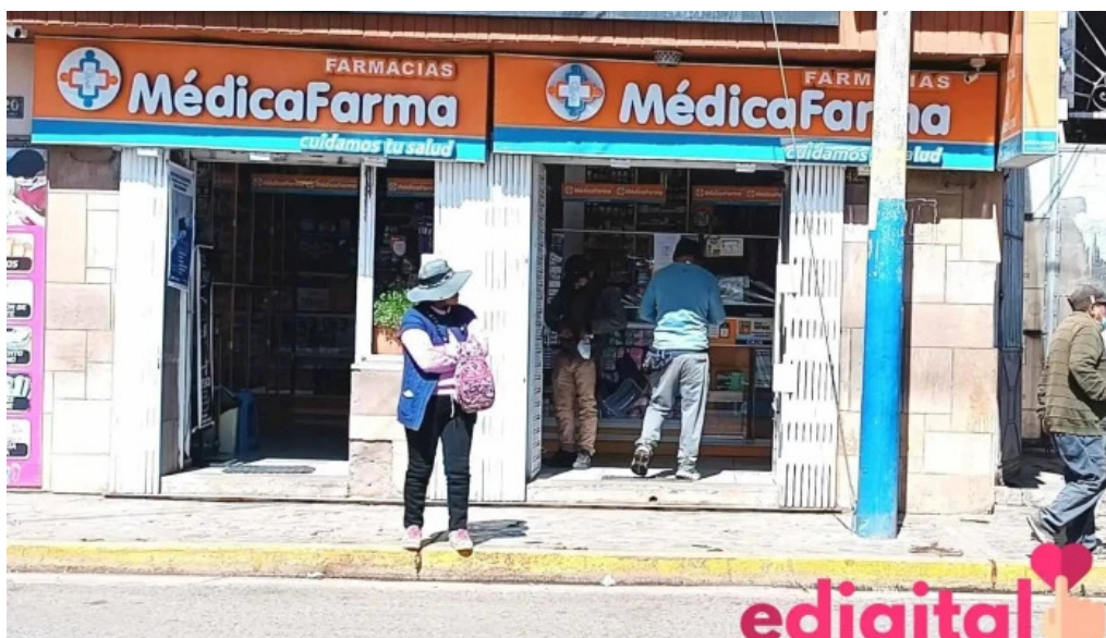
Farmacia medicafarma juliaca juliaca