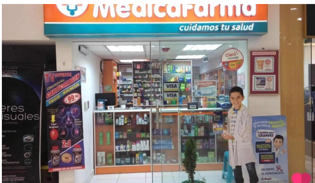
Farmacia medicafarma juliaca del propietario