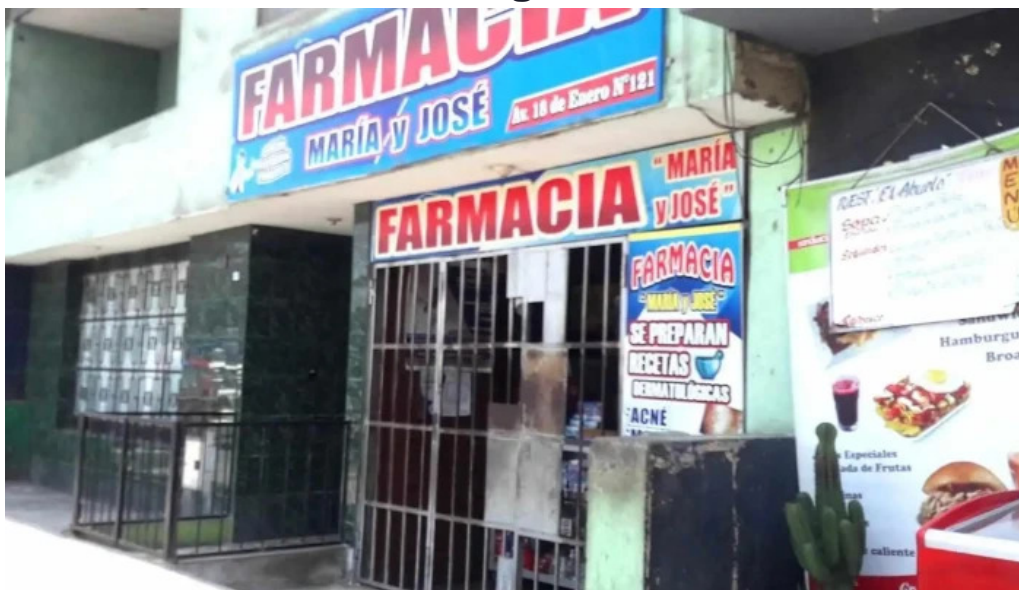
Farmacia maria jose precios