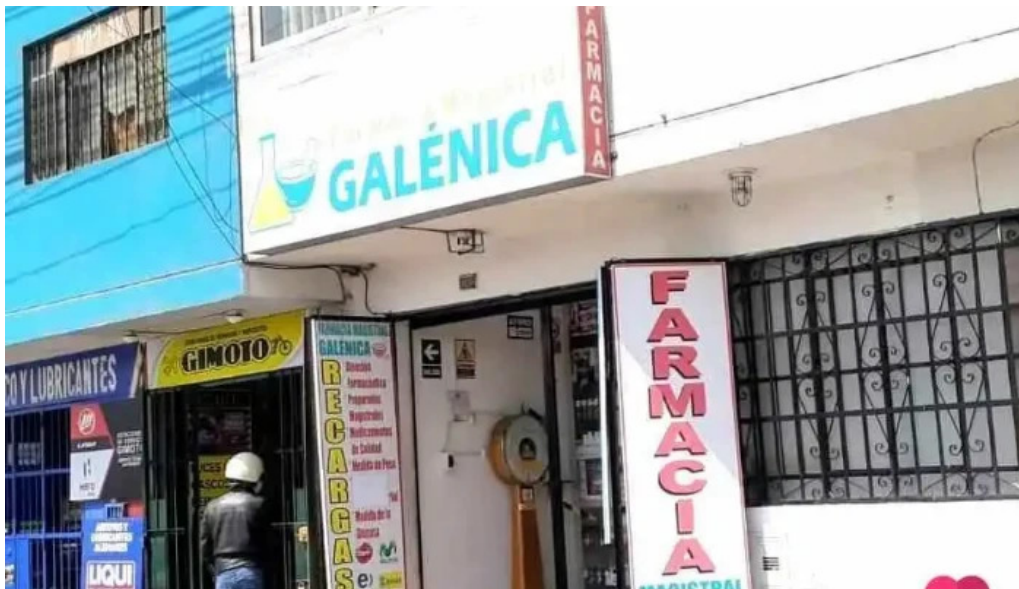
Farmacia magistral galenica puntaje