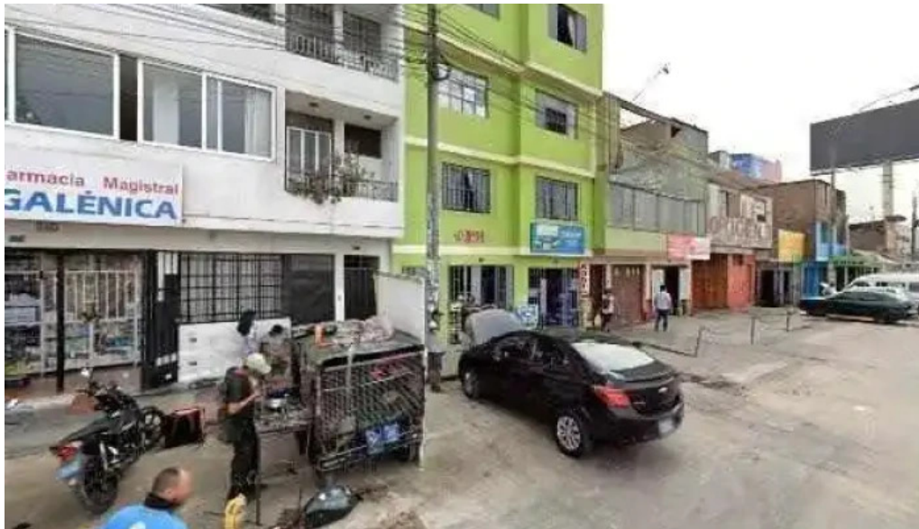
Farmacia magistral galenica puntajedeg