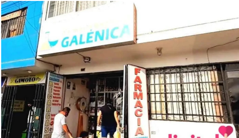
Farmacia magistral galenica del propietario