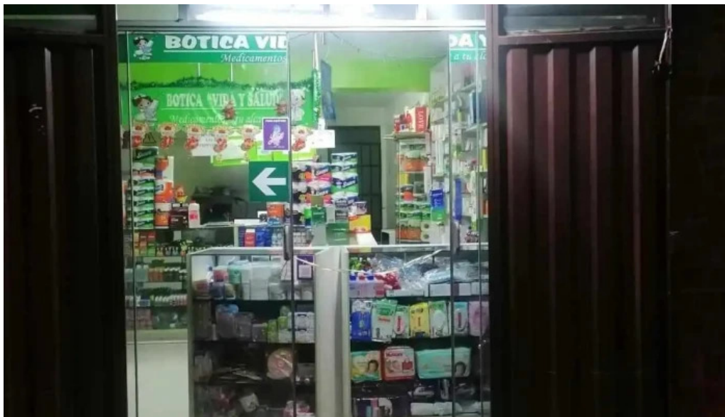
Botica vida y salud huaraz del propietario