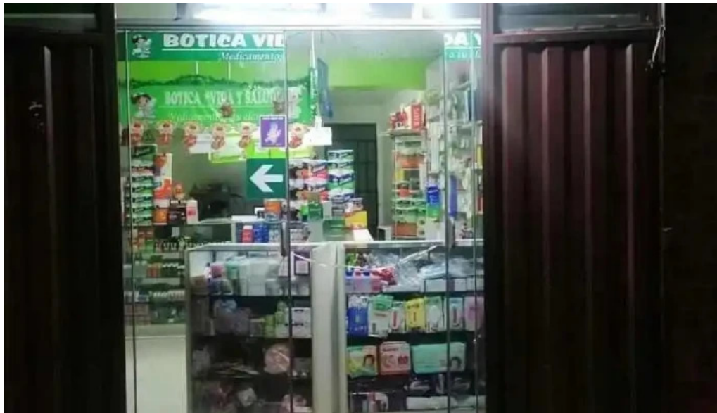
Botica vida y salud huaraz independencia