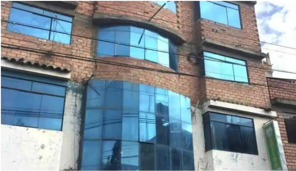
Botica vida y salud huaraz zona