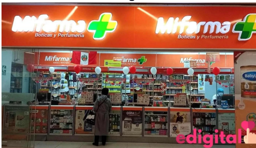
Mi farma telefono