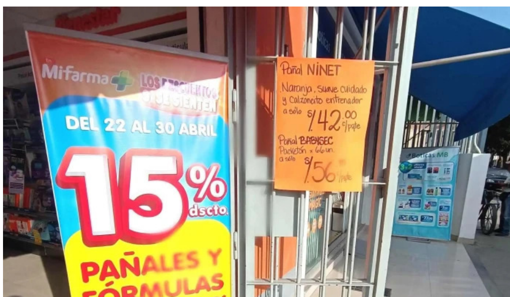
Mi farma ica