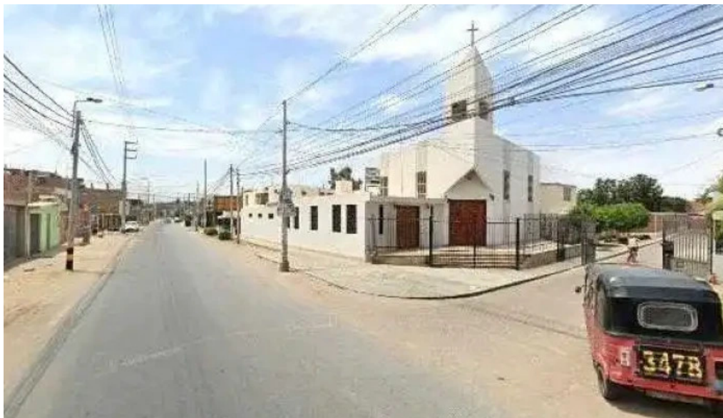
Farmacia maria esperanza eirl fotosdeg