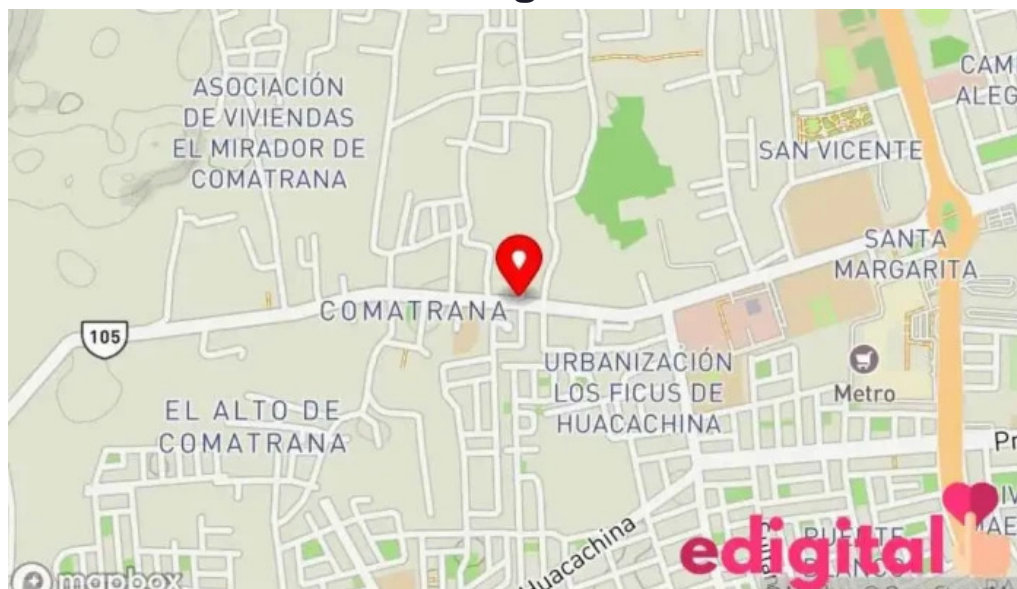
Farmacia maria esperanza eirl mapa