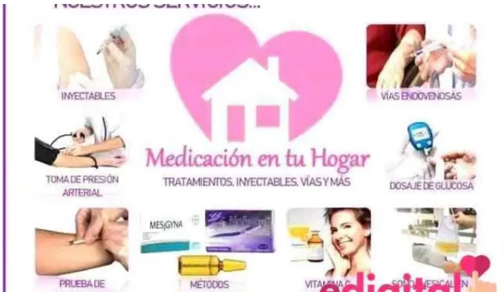
Farmacia maria esperanza eirl ica