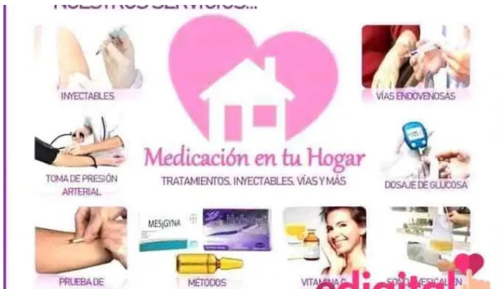
Farmacia maria esperanza eirl fotos