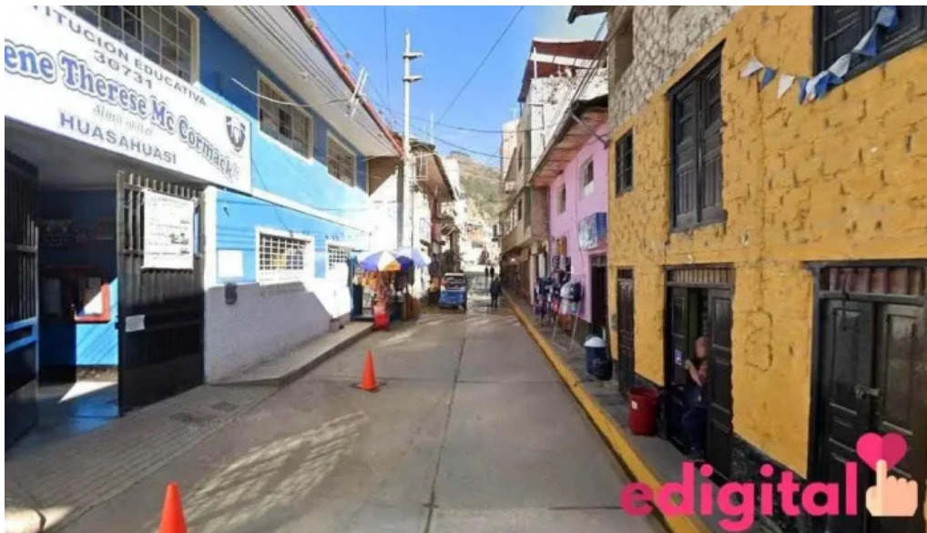
Farmacia san juan bautista huasahuasi