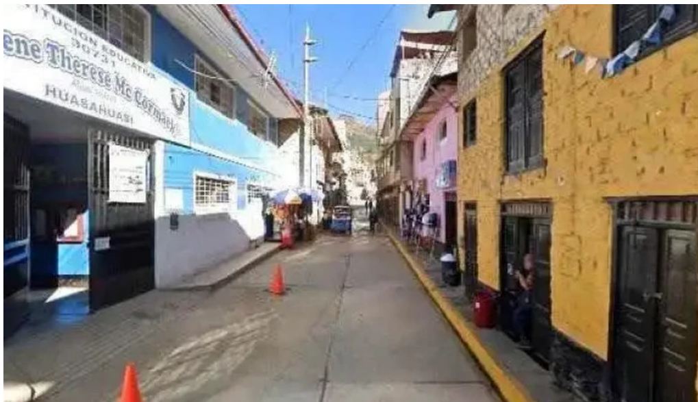
Farmacia san juan bautista numero