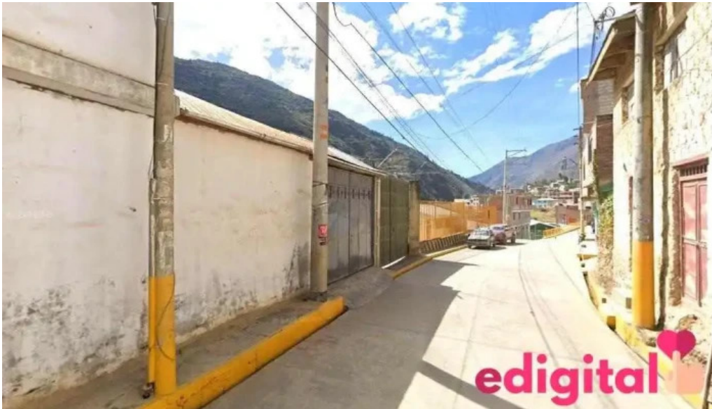
Botica confianza huasahuasi