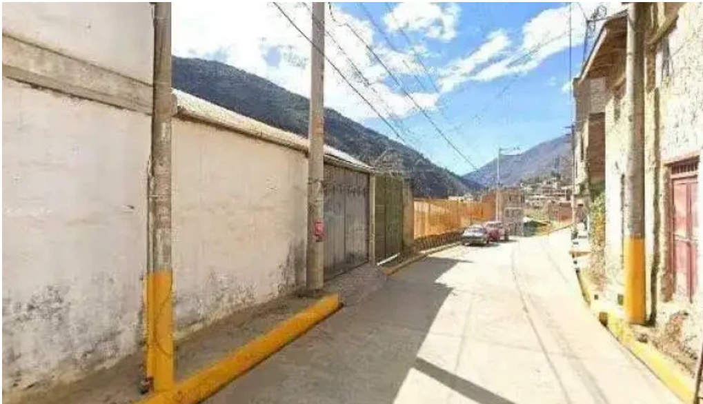
Botica confianza ubicacion